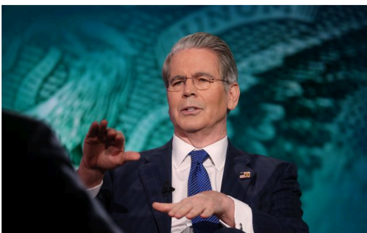
міністр фінансів США Скотт Бессент

Вимкни хаос міжнародних новин! Отримуй тільки важливе з РБК-Україна у Google