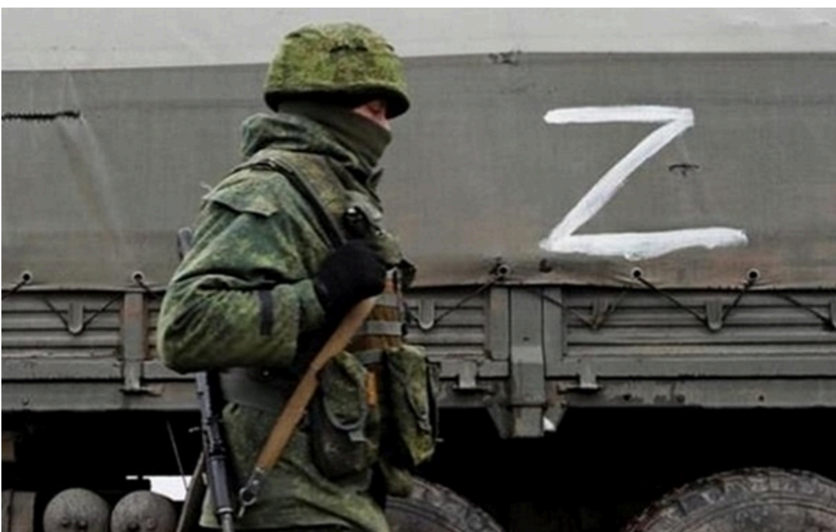
(ілюстративне фото) Путін збільшує чисельність війська РФ

Чисельність ЗС Росії тепер становить 2 399 130 осіб, що на вісім тисяч більше, ніж до цього.