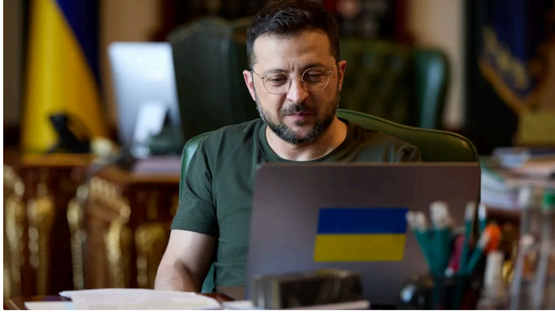
Російську мову прибирають із переліку хартії, щоб захистити й посилити роль державної української мови, вказано в пояснювальній записці

12 червня, 22:55 🗨️ Етот материал также можно прочитать на русском