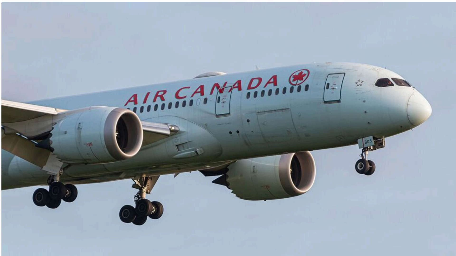
Волл здійснив майже 1 тис. рейсів без ліцензії

12 червня, 23.01 🗨️ Этот материал также можно прочитать на русском