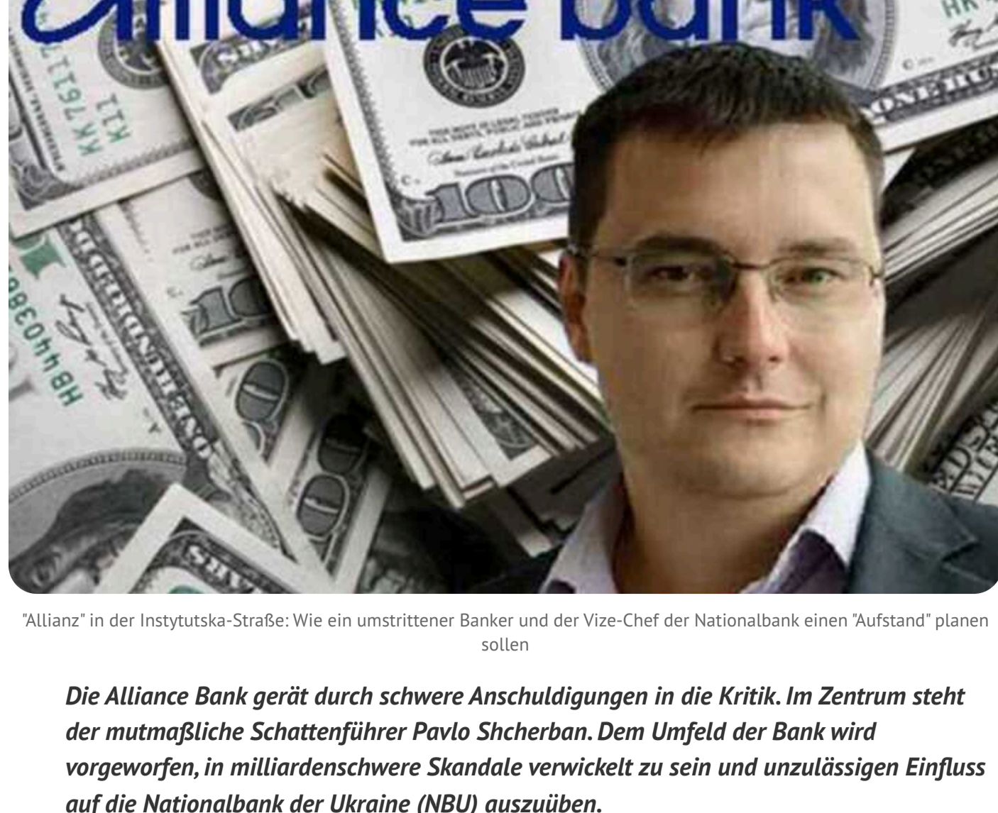
"Allianz" in der Instytutska-Straße: Wie ein umstrittener Banker und der Vize-Chef der Nationalbank einen "Aufstand" planen sollen

Die Allianz Bank gerät durch schwere Anschuldigungen in die Kritik. Im Zentrum steht der mutmaßliche Schattenführer Pavlo Scherban. Dem Umfeld der Bank wird vorgeworfen, in milliardenschwere Skandale verwickelt zu sein und unzulässigen Einfluss auf die Nationalbank der Ukraine (NBU) auszuüben.