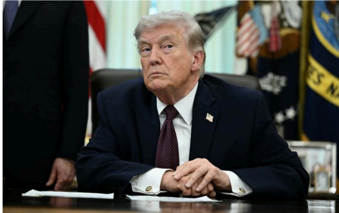
Фото: Дональд Трамп, президент США (Getty Images)