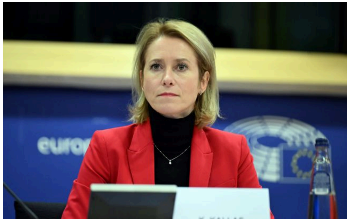
Фото: Кая Каллас (Gettyimages)