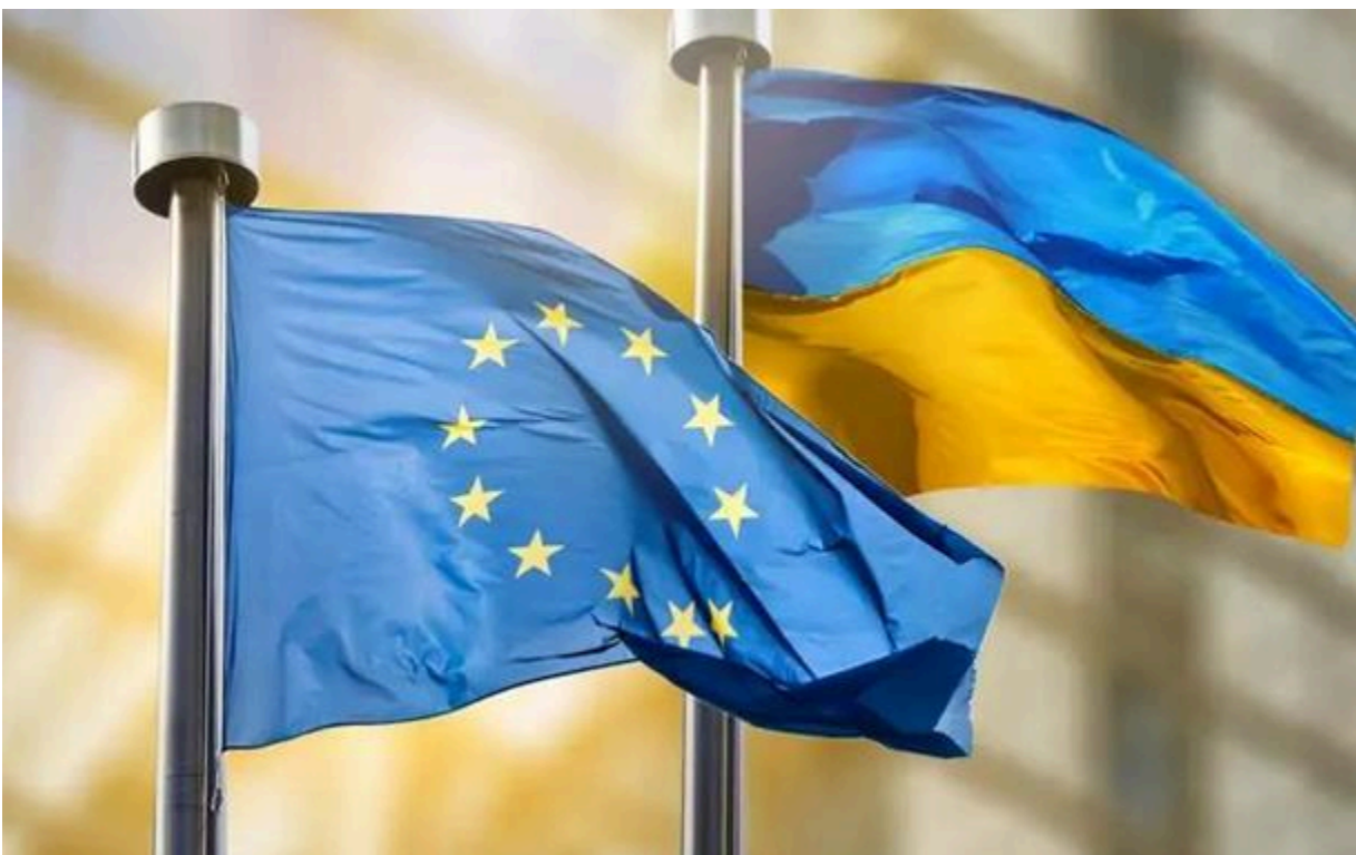
ЄС офіційно підтвердив початок вступних переговорів з Україною

Засідання Конференції з питань вступу України відбудеться в Люксембурзі 15 червня 2026 року.