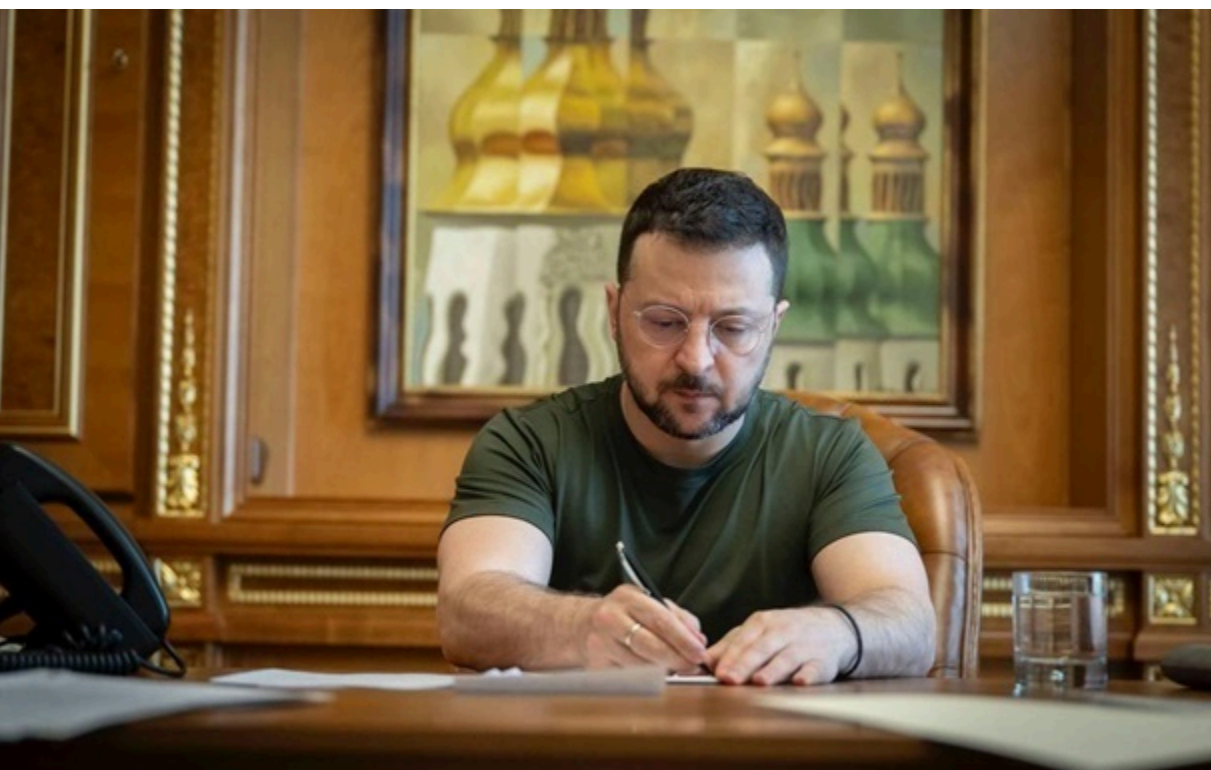
Підписано закон, що виключає російську мову з-під захисту європейськими правилами

Російську мову вилучено з переліку мов, до яких Україна застосовує положення Хартії. Це важливе рішення для захисту українського мовного простору.