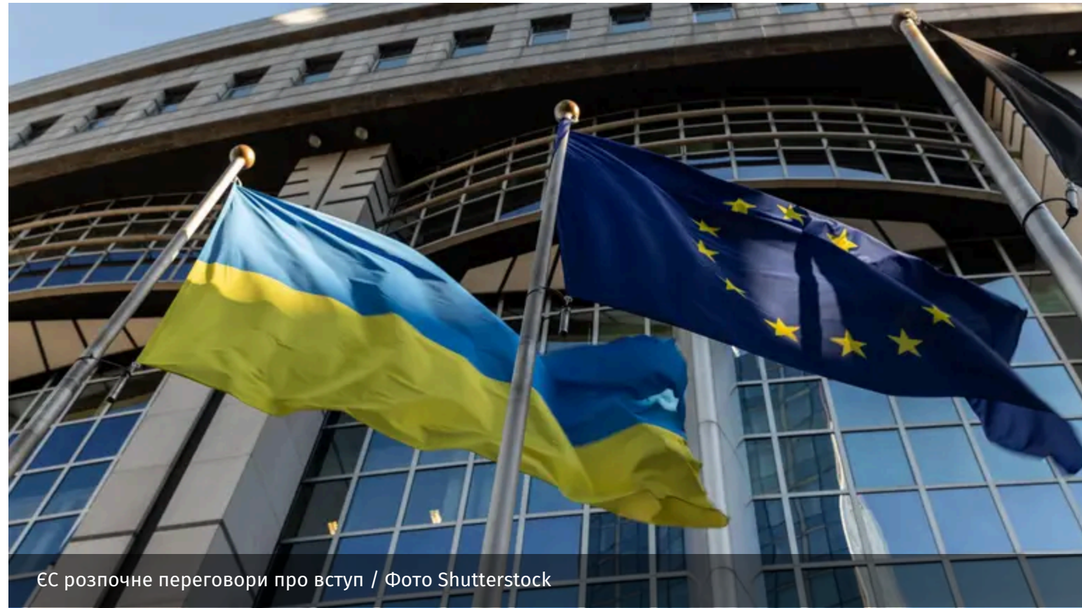
ЄС розпочне переговори про вступ

Країни Євросоюзу погодили початок переговорів про вступ України та Молдови до ЄС. Вони офіційно розпочнуться 15 червня.