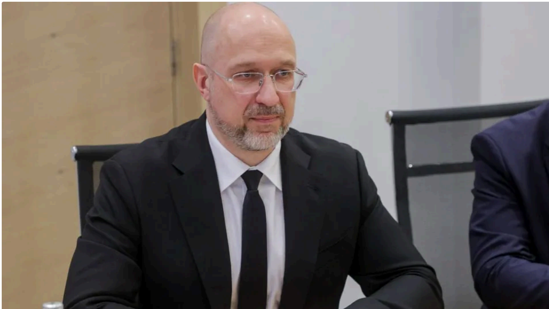
Шмигаль заявив про плани уряду щодо реформи балансувального енергоринку Фото: Денис Шмигаль | Перший віцепрем'єр – Міністр енергетики України / Telegram

12 червня, 20:36 🗨️ Этот материал также можно прочитать на русском