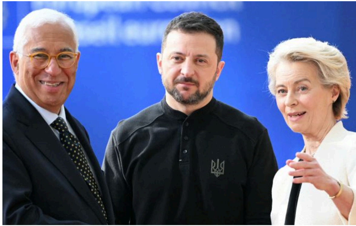
Фото: голова Євроради Антоніу Кошта, президент України Володимир Зеленський та голова ЄК Урсула фон дер Ляєн