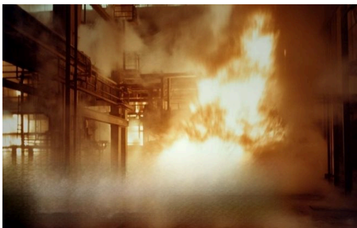
Фото: пожежа на енергооб'єкті