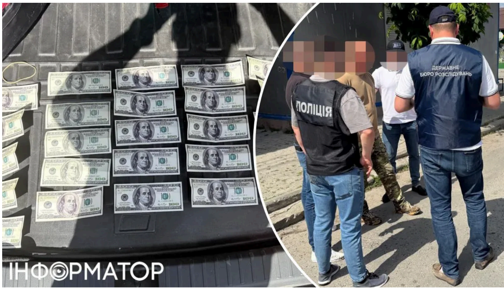
Підполковник ТЦК торгував доступом до "Оберіга"

Начальника одного з відділів Тернопільського районного ТЦК затримали на хабарі - він продавав обіцянку видалити дані про розшук військовозобов'язаного з державного реєстру "Оберіг". Корупційні справи проти керівників ТЦК в Україні стають дедалі частішими - нещодавно підозру отримав ще один начальник ТЦК, якого викрили на недекларованому майні. Спецоперацію провели спільно ДБР та Департамент внутрішньої безпеки Національної поліції. Підозрюваному загрожує до восьми років позбавлення волі.