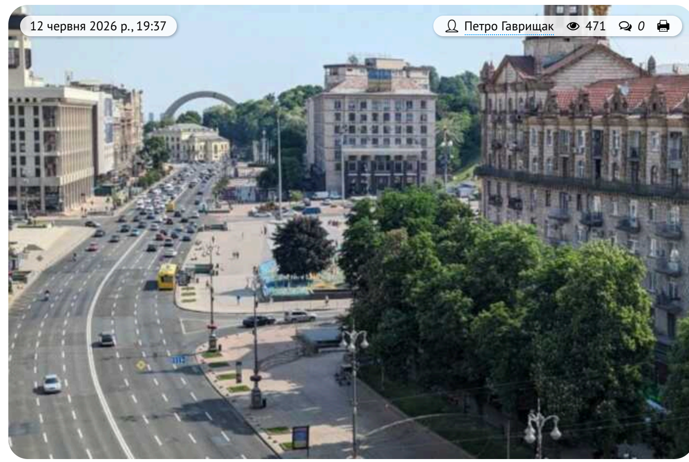
Хрещатик під час війни: скільки мільйонів «закопали» у головну вулицю країни

За останні 4,5 роки на головній вулиці Києва проводилися виключно локальні роботи з ліквідації дефектів покриття, які виконували сили Шевченківського району. Водночас масштабна реконструкція вартістю майже 740 мільйонів гривень, запланована ще до початку великої війни, наразі заморожена через осінній стан.