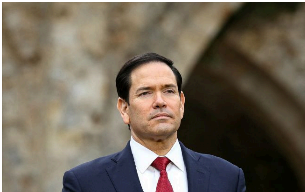
Фото: Марко Рубіо (Getty Images)