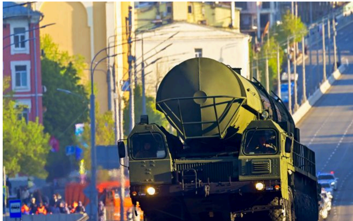
Фото: американці попередили Україну про загрозу удару РФ