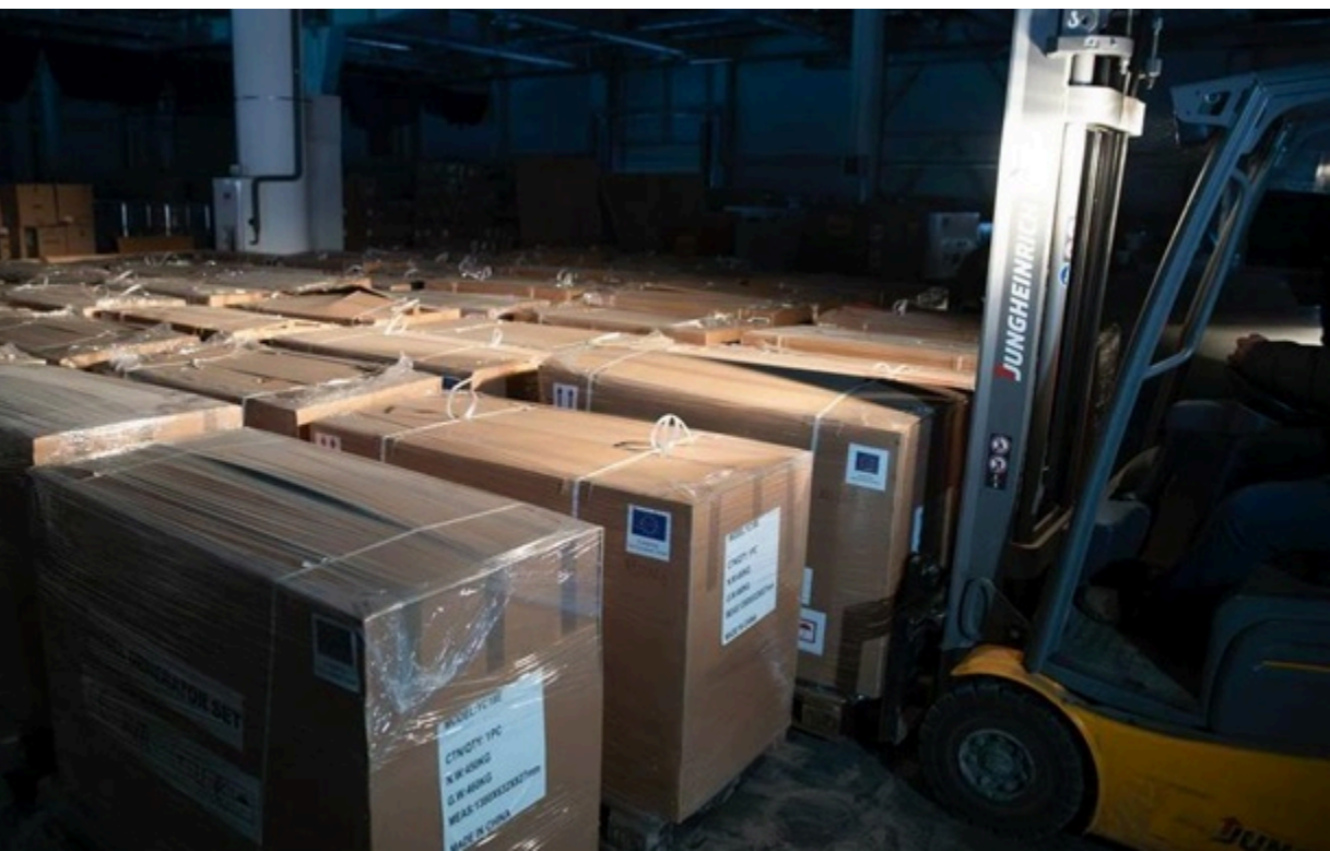
(ілюстраційне фото) Україна скоротила імпорт електрогенераторів

У травні-2026 ввезення обладнання скоротилося на 46% порівняно з травнем-2025, але дещо збільшилося у порівнянні з квітнем-2026 - до $62,4 млн.