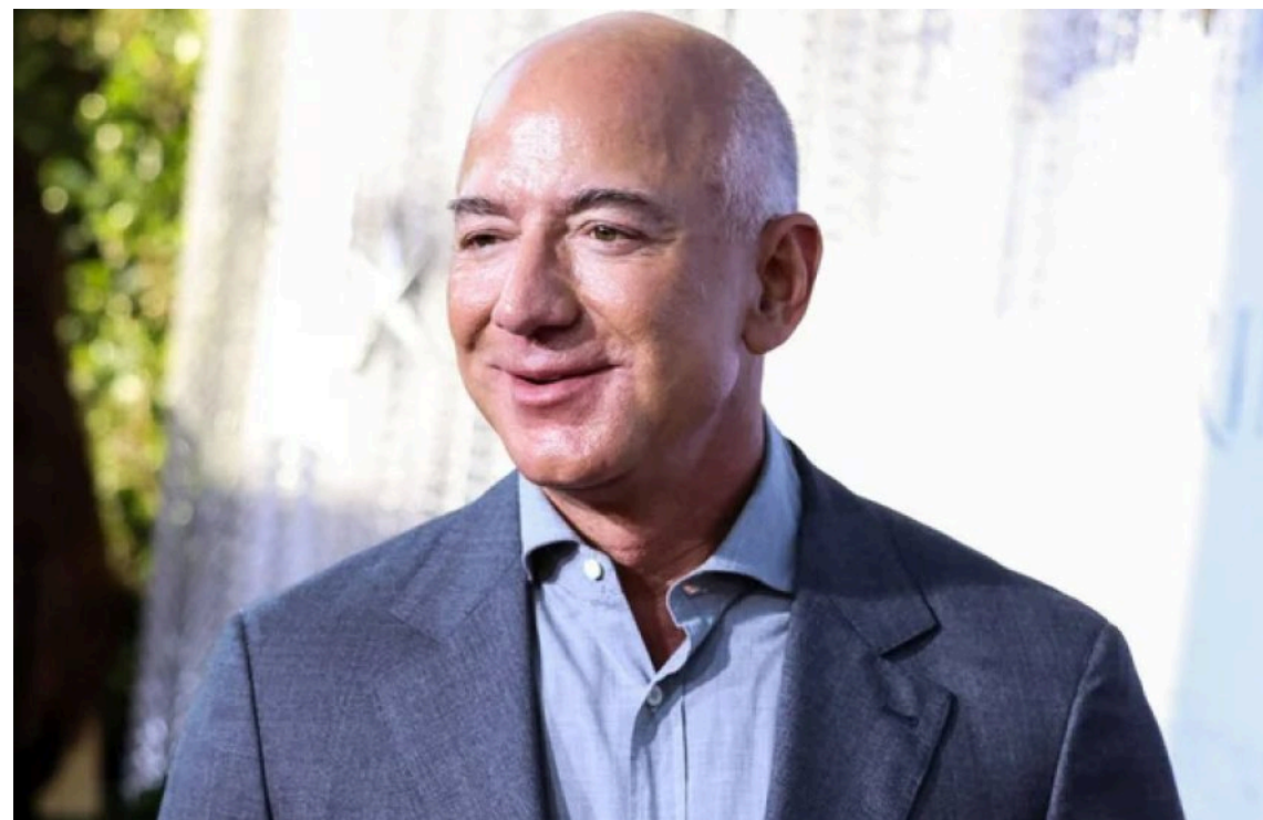
ШІ-стартап Джеффа Безоса залучив $12 мільярдів інвестицій

Стартап у сфері штучного інтелекту Prometheus, який очолює засновник Amazon Джефф Безос, залучив потужний раунд фінансування, що підвищило його ринкову оцінку до 41 мільярда доларів. Це закріплює статус мільярдера як одного з провідних гравців глобального ШІ-буму.