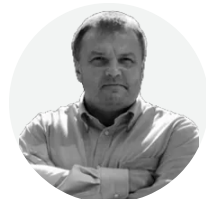
Автор колонки: Вадим Денисенко

Візит європейської комісарки з питань розширення Марти Кос показав, що ЄС прийняв базову модель Мерца про поетапний вступ України до ЄС. Кос доволі ультимативно дала зрозуміти: ця модель єдино можлива.