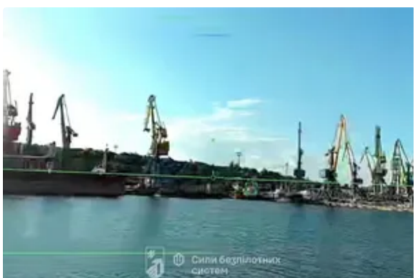
"Болісний удар". Росіяни втратили порт Маріуполя як логістичний хаб. Що відомо про спецоперацію 10 червня, 12:47 ВІЙНА В УКРАЇНІ