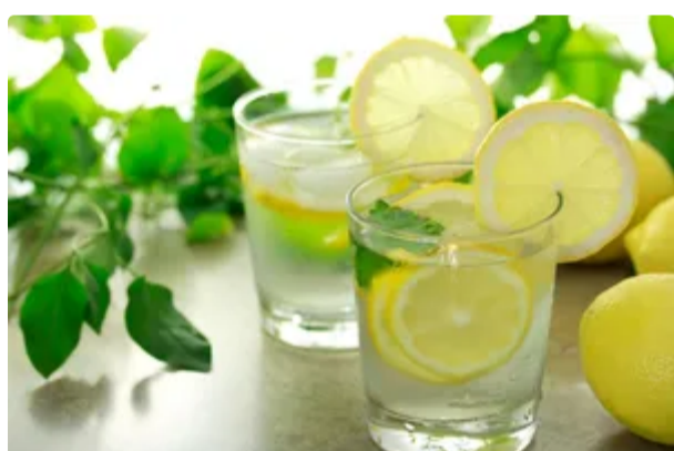
Секретний рецепт улюбленого напою Єлизавети II – пахне пригломшливо, а на смак ще кращий 12 червня, 18:05 БУЛЬВАР