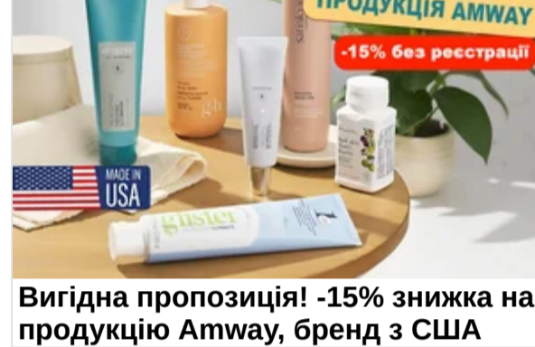
Вигідна пропозиція! -15% знижка на продукцію Amway, бренд з США