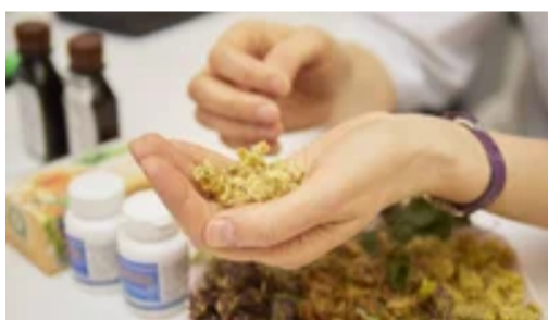
Лікарі нетрадиційної медицини. Безкоштовна консультація по Viber