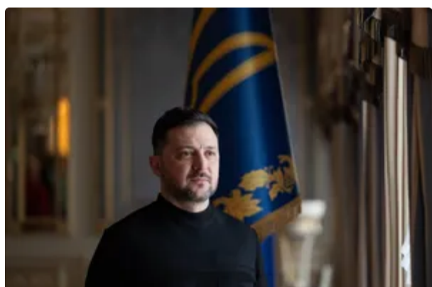
Зеленський оголосив про нові виплати для військових. Міноборони назвало суми 12 червня, 16:43 ВІЙНА В УКРАЇНІ