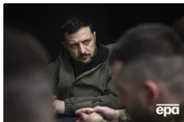
"І сьогодні, і наступними днями". ЗСУ попередили про загрозу "Орешніка", Зеленський звернувся до українців 12 червня, 17:10 ВІЙНА В УКРАЇНІ