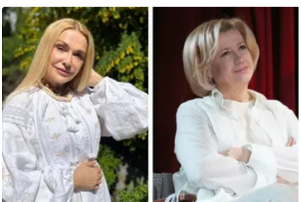
Хто може бути актрисою, яку Сумська звинуватила у своєму звільненні з театру? 12 червня, 17:28 БУЛЬВАР