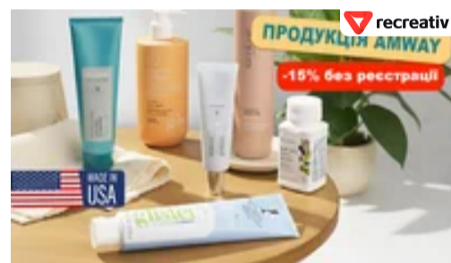
Вигідна пропозиція! -15% знижка на продукцію Amway, бренд з США