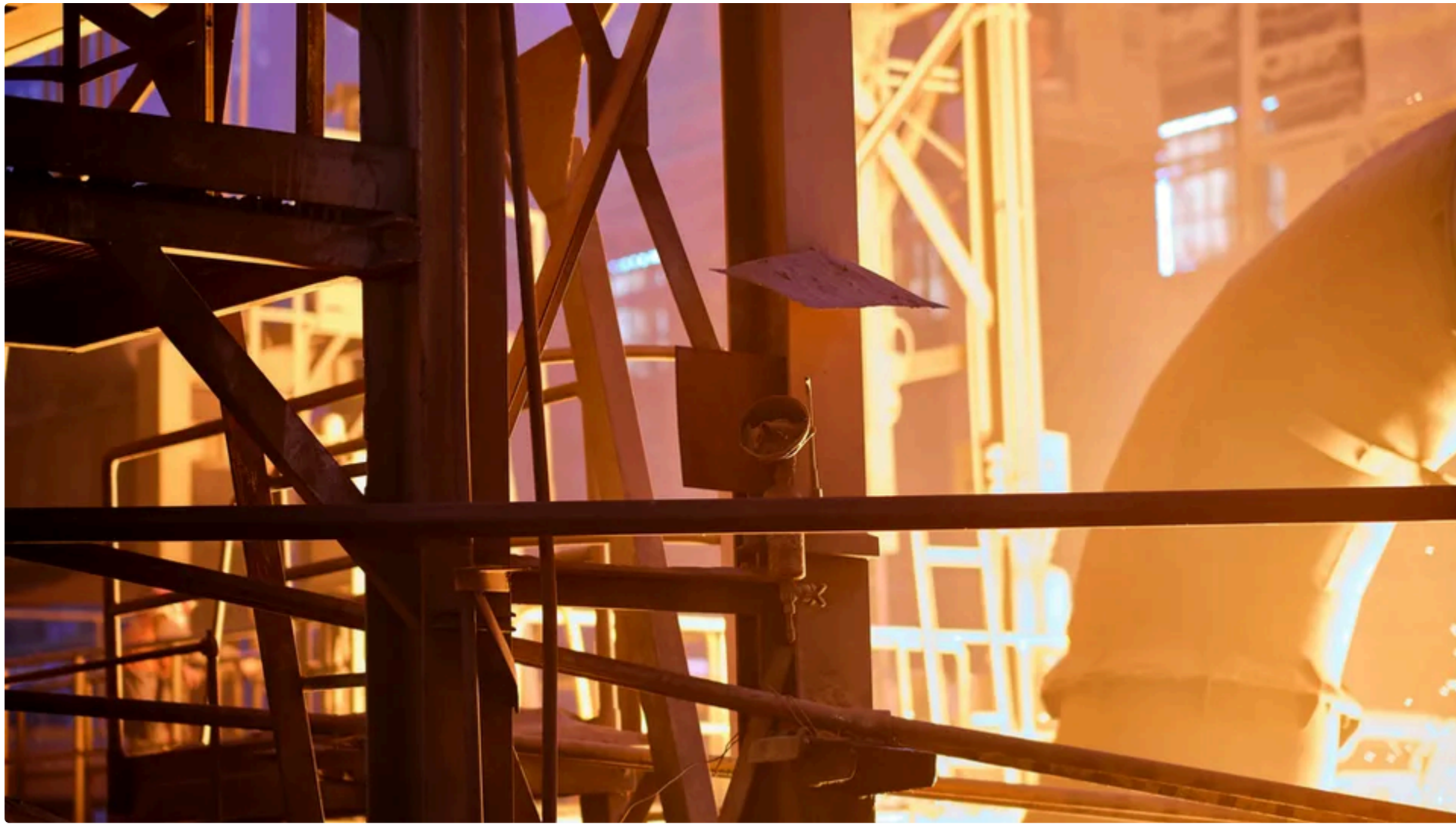
Forbes: Нові торгові обмеження ЄС є викликом для українського експорту

У Європейському союзу (ЄС) з 1 липня набуває чинності нова система захисту внутрішнього ринку сталі. Потенційні втрати українського експорту можуть сягнути €1 млрд на рік, але країна має простір для переговорів, які можуть зменшити тиск на промисловість. Про це йдеться у матеріалі видання Forbes Ukraine.