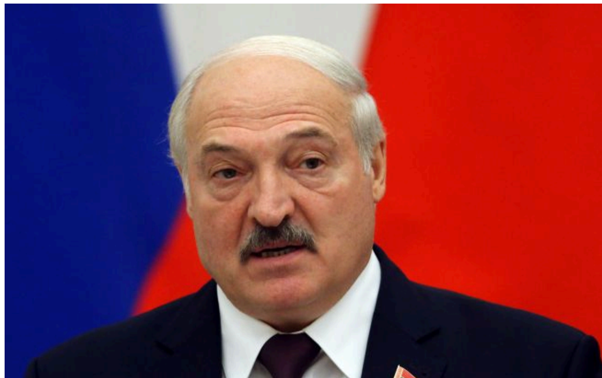
Фото: білоруський диктатор Олександр Лукашенко

Не витрачай час на шум! Читай тільки суть з РБК-Україна у Google