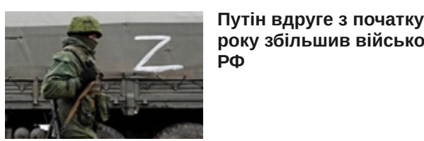
Путін вдруге з початку року збільшив військю РФ

Путін пообіцяв створити супутникове угруповання, що перевершить Starlink Путін пригрозив посиленням ударів по Україні Адам Кадиров вдруге отримав звання героя Чечні У районі порту Усть-Луга стався вибух - росЗМІ