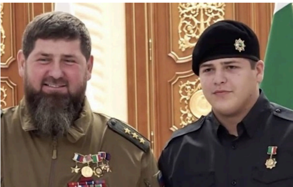
Фото: t.me/flashid_chemezov (архівне фото) Адам Кадиров вдруге отримав звання Героя Чечні

Звання присвоєно указом Кадирова-старшого "за визначні заслуги перед державою, беззавітне служіння народу."