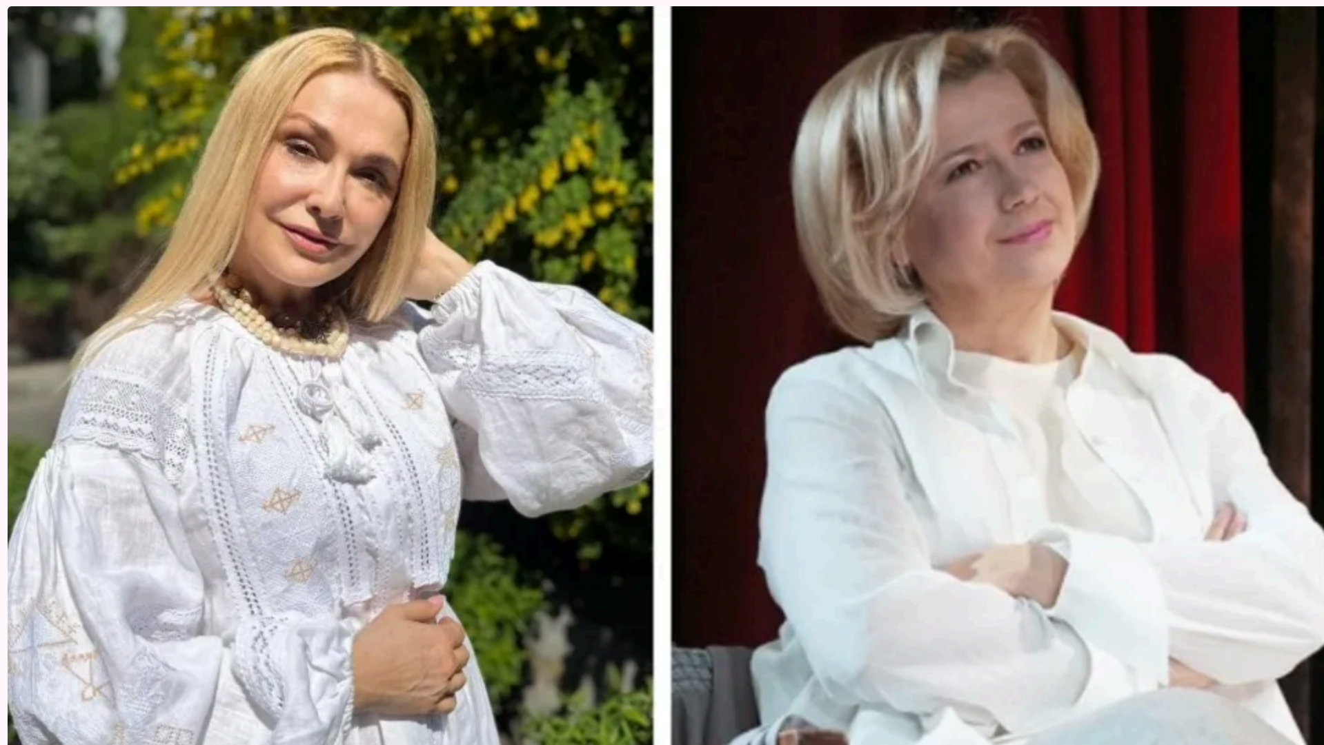
Назарова різко висловлювалася про Сумську

12 червня, 17:28 🗨️ Цей матеріал також можна прочитати на руском