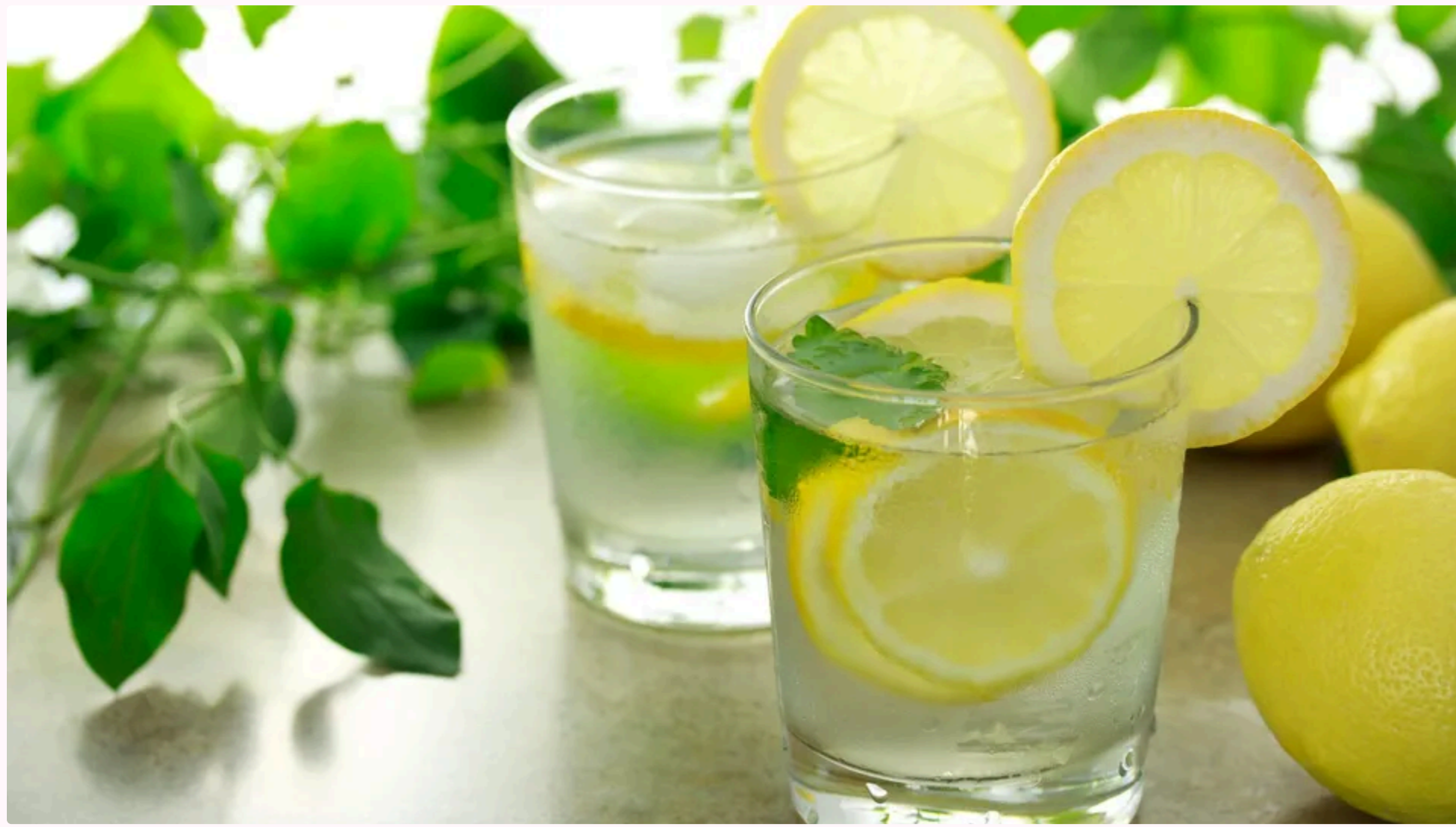
Кухар зазначив, що готував для королеви та членів її сім'ї цей секретний напій раз на місяць.

12 червня, 18.05 🗨️ Этот материал также можно прочитать на русском