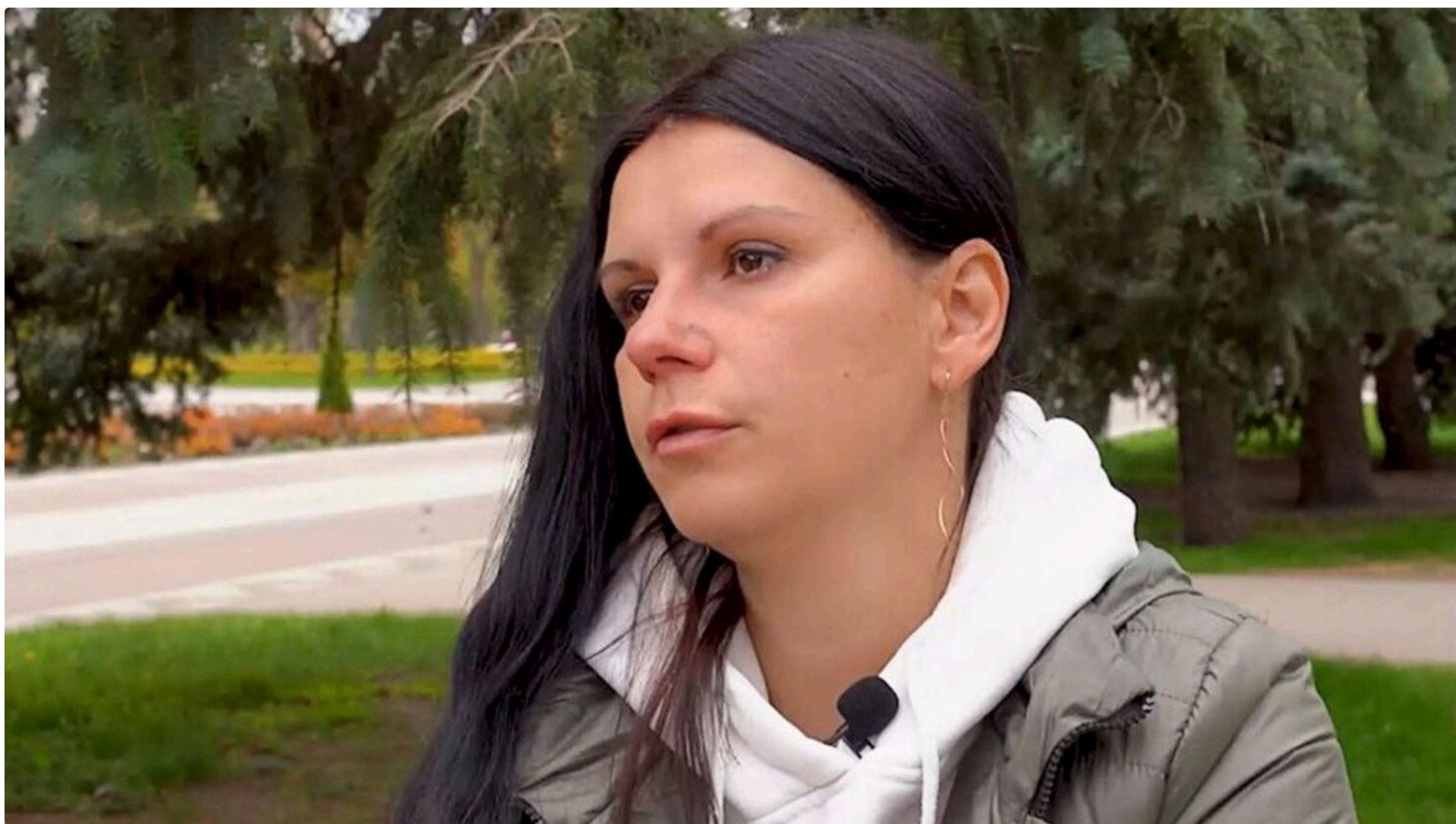
Історія сім'ї з Краматорська увійшла до музею "Голоси Мирних"

12 червня, 16:18 🗨️ Этот материал также можно прочитать на русском