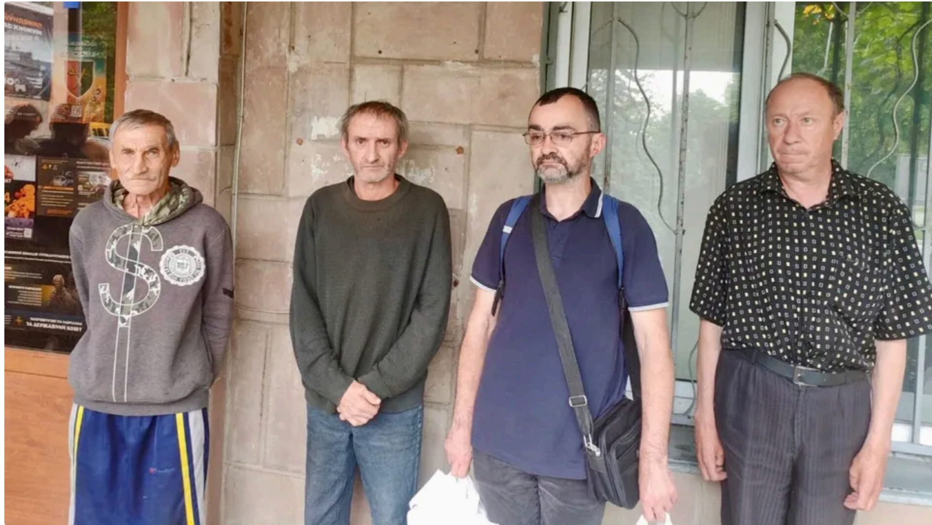
За словами омбудсмена, після втручання його команди п'ятьох людей звільнили з ТЦК, оскільки вони не підлягали мобілізації.

У Тернопільському об'єднаному міському територіальному центрі комплектування та соціальної підтримки могли порушувати права окремих громадян під час мобілізаційних заходів. Про це 12 червня у Facebook повідомив уповноважений Верховної Ради з прав людини Дмитро Лубінець.