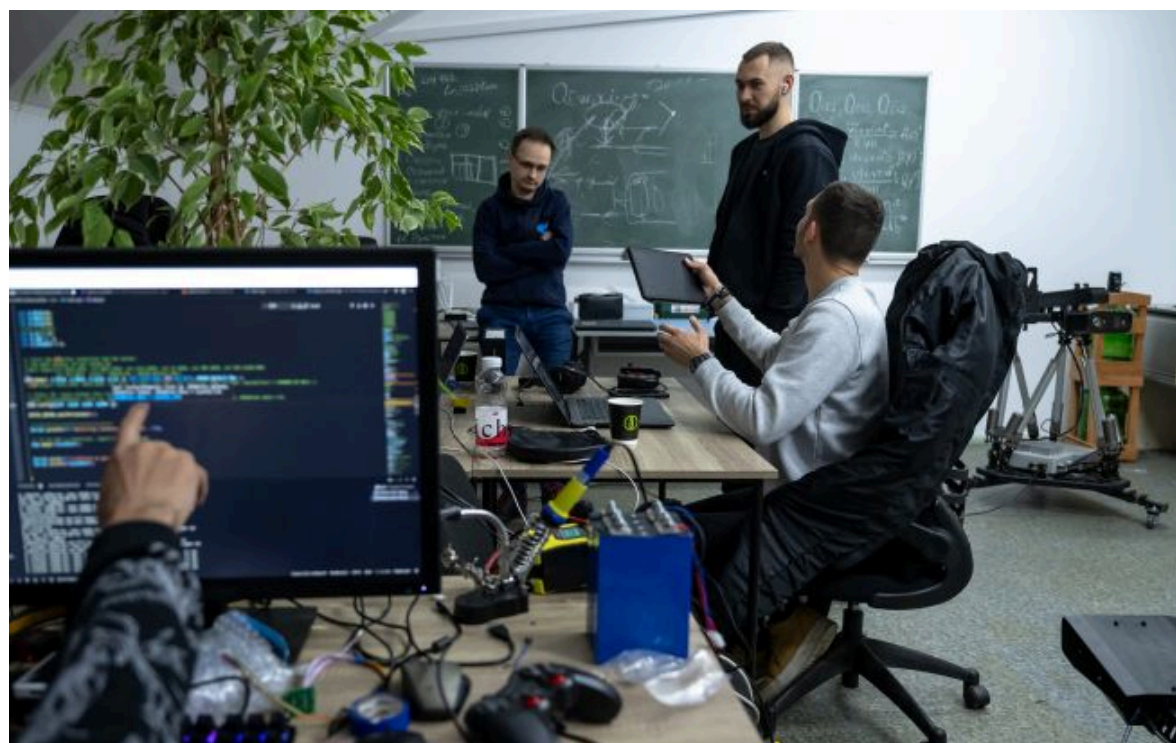
Робота у вихідні дні має додатково оплачуватися

Не витрачай час на шум! Читай тільки суть з РБК-Україна у Google