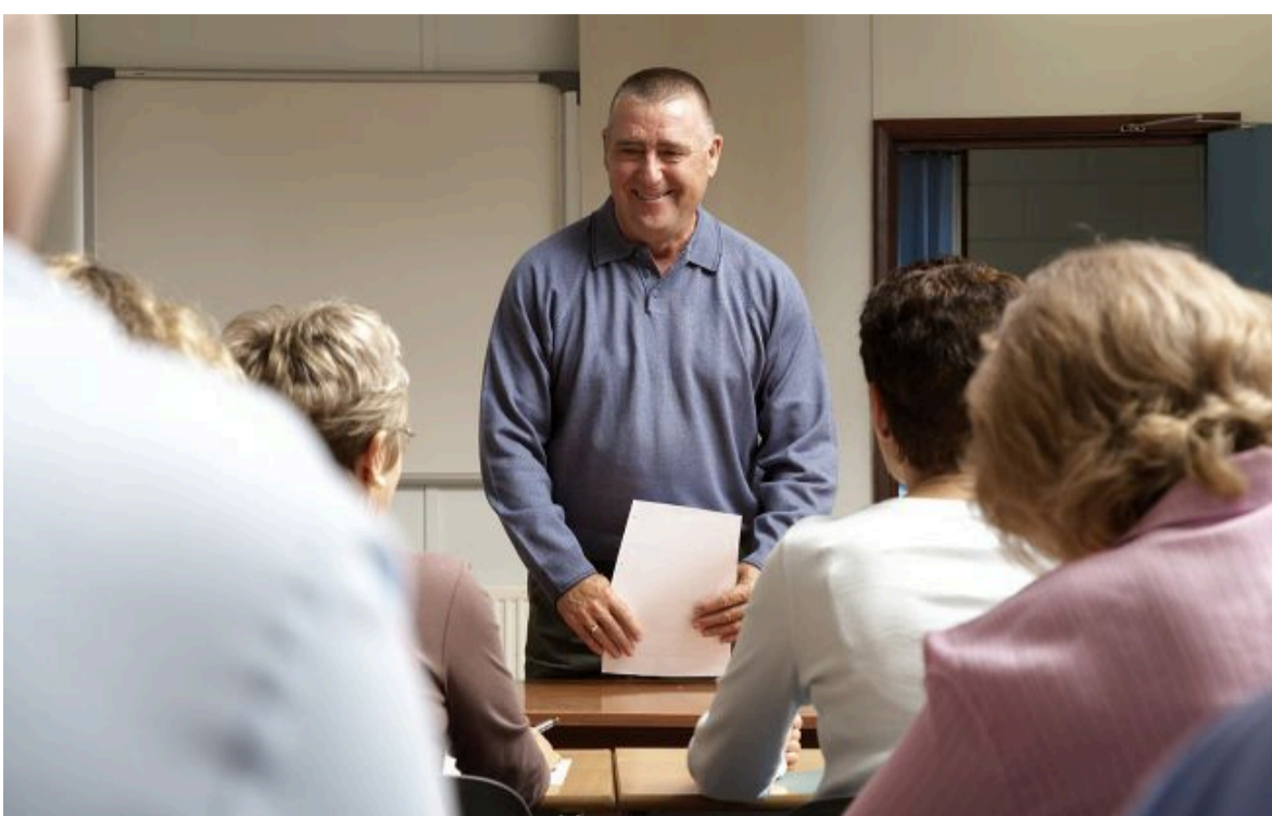
Фото: В Україні дорослі стали частіше освоювати нові професії (Getty Images)

Не витрачай час на шум! Читай тільки суть з РБК-Україна у Google