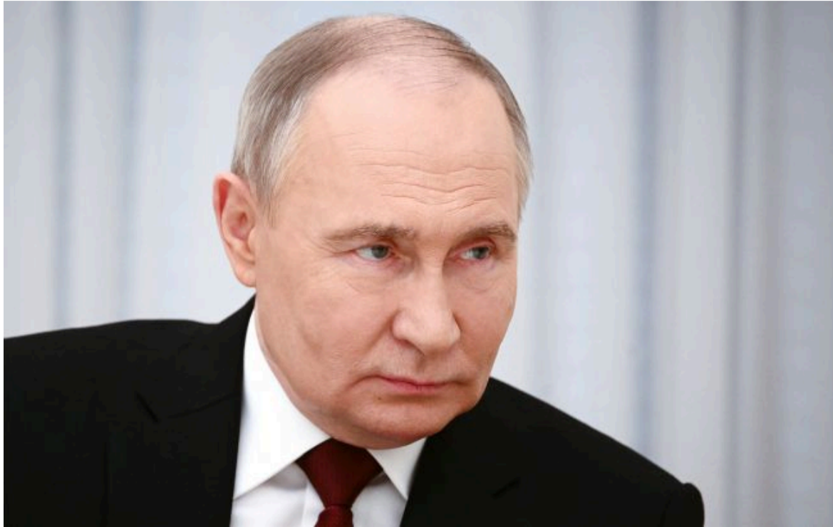
Фото: Володимир Путін, російський диктатор (Getty Images)