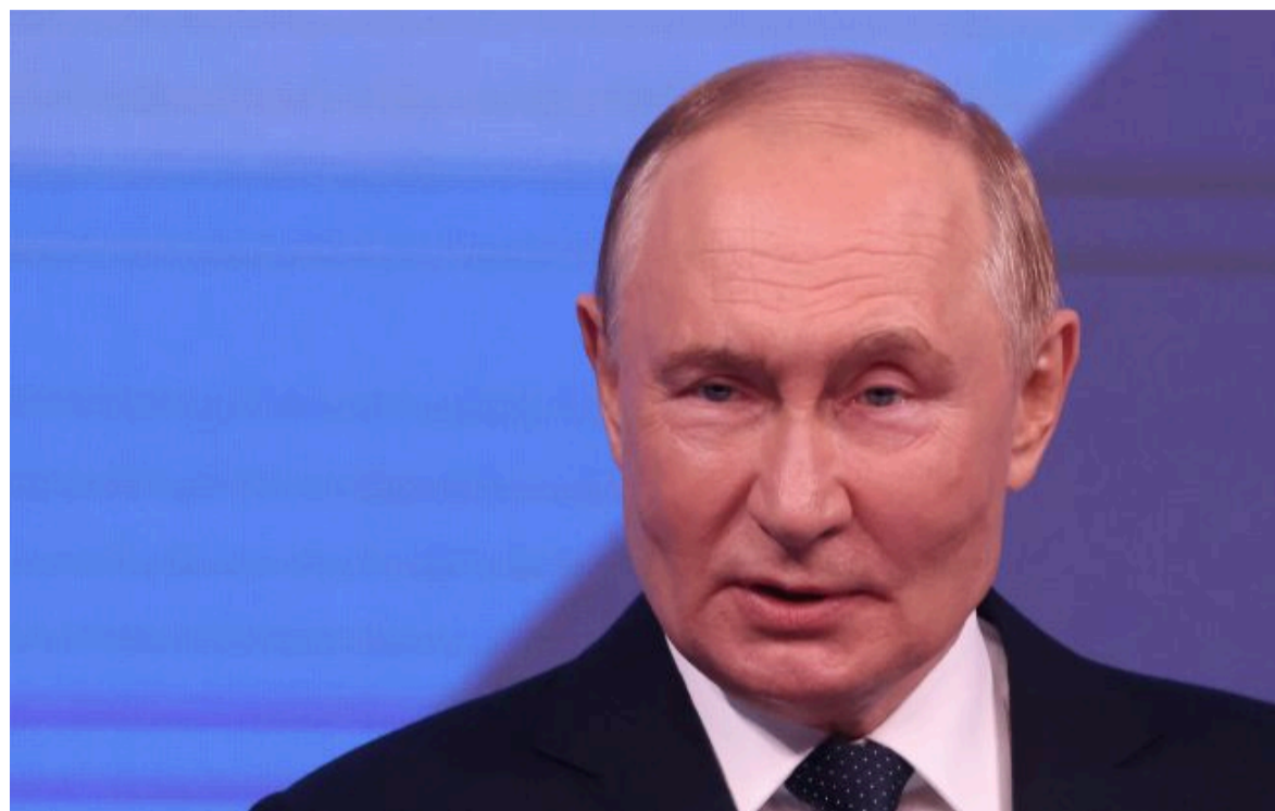
Фото: Володимир Путін (Gettyimages)