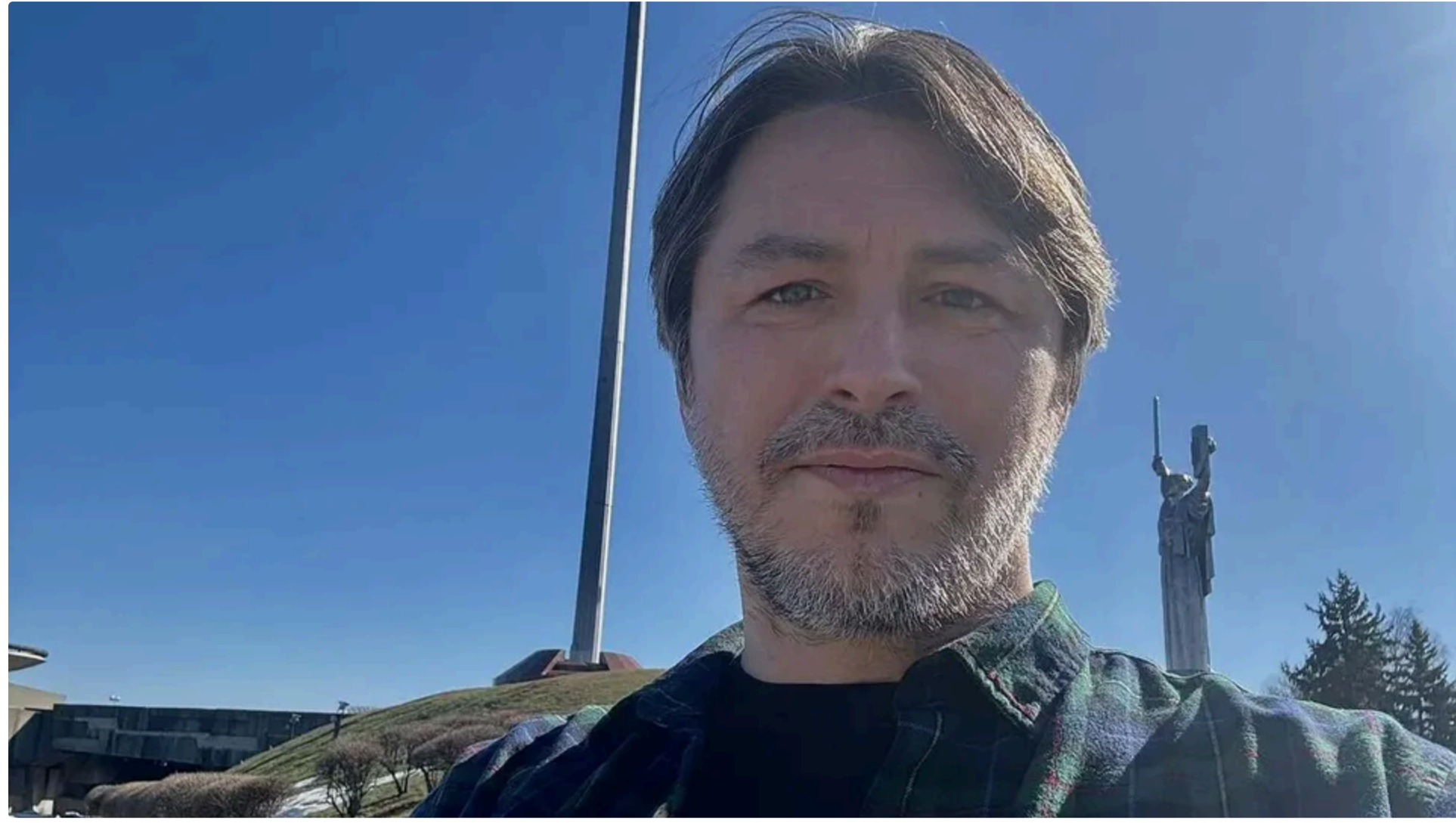
Притула: Мати тих, хто любіє інтереси українців у польському парламенті, краще, ніж не мати

12 червня, 16.27 🗨️ Этот материал также можно прочитать на русском