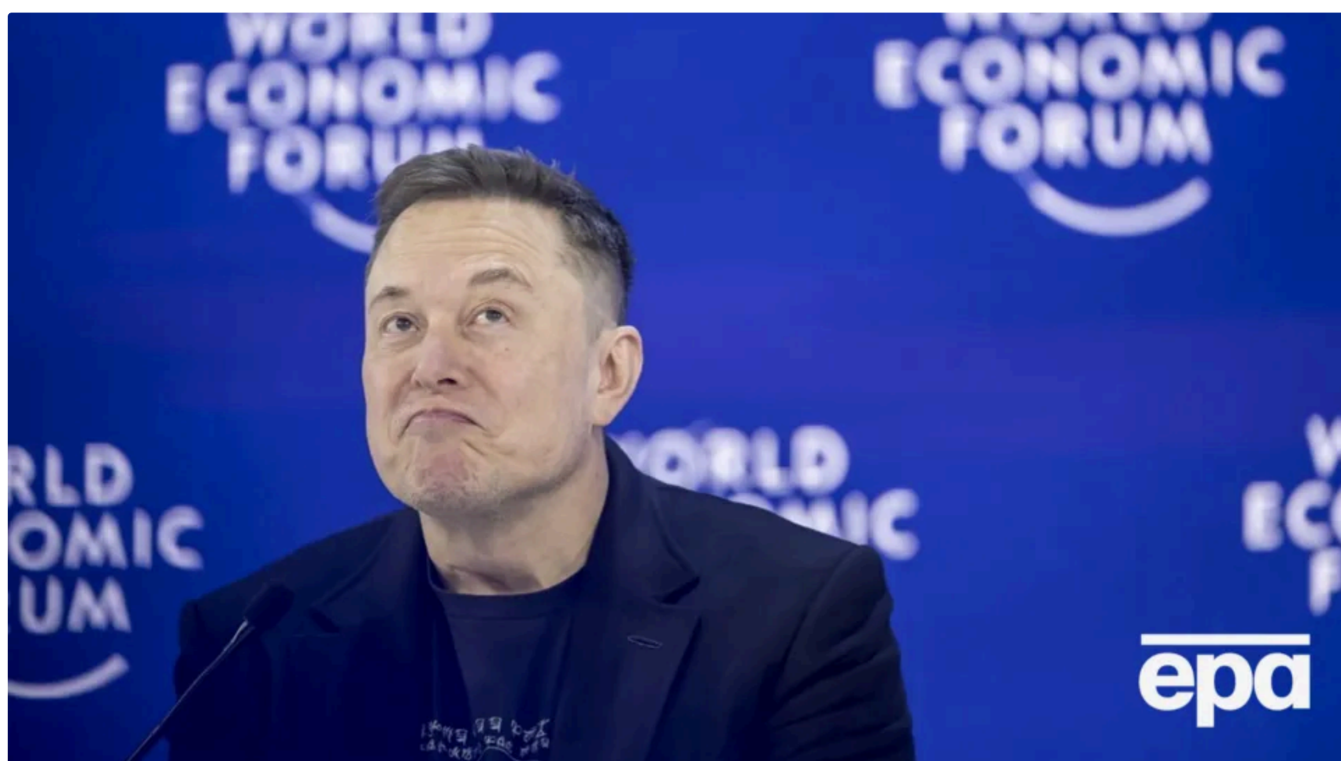
Маск пройшов шлях від мільярда до першого трильйонера у світі приблизно за 14 років

12 червня, 16.34 🗨️ Цей матеріал також можна прочитати на русско