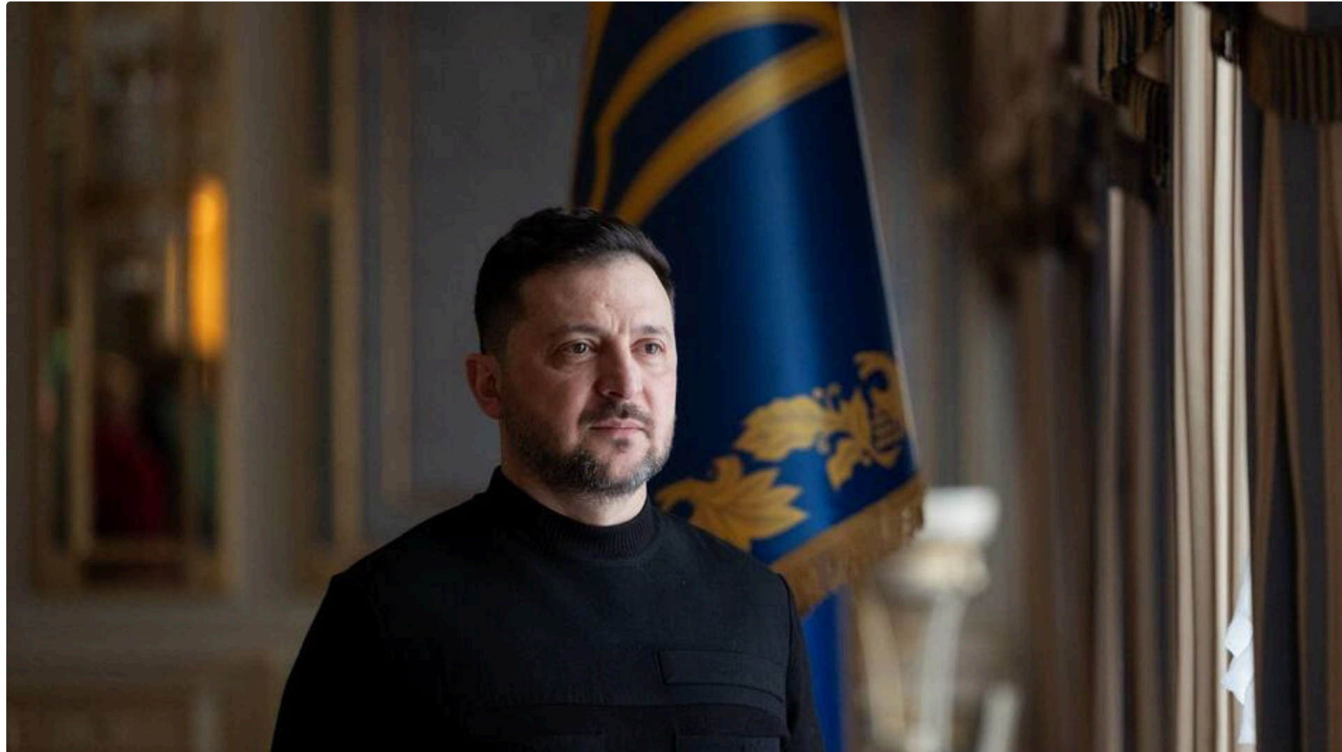
Зеленський оголосив про трансформацію ЗСУ

12 червня, 16.43 📌 Этот материал также можно прочитать на русском