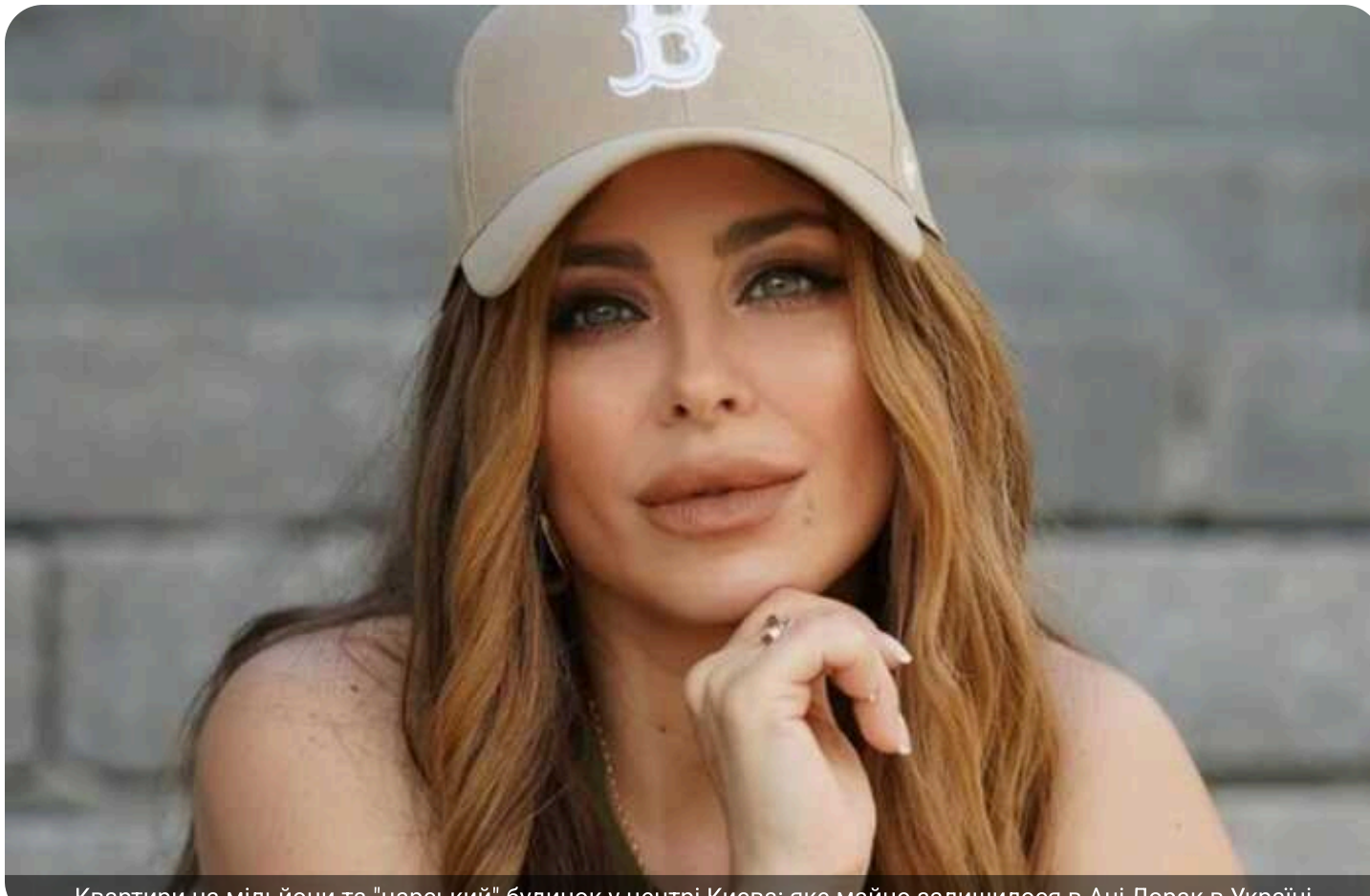
Квартири на мільйони та "царський" будинок у центрі Києва: яке майно залишилося в Ані Лорак в Україні

Співачка Ані Лорак, яка під час війни розважає росіян і мовчить про злочини окупантів, досі має в Україні великі статки. На зрадничю зареєстровано дев'ять об'єктів нерухомості, загальна ринкова вартість яких сягає мільйони доларів.