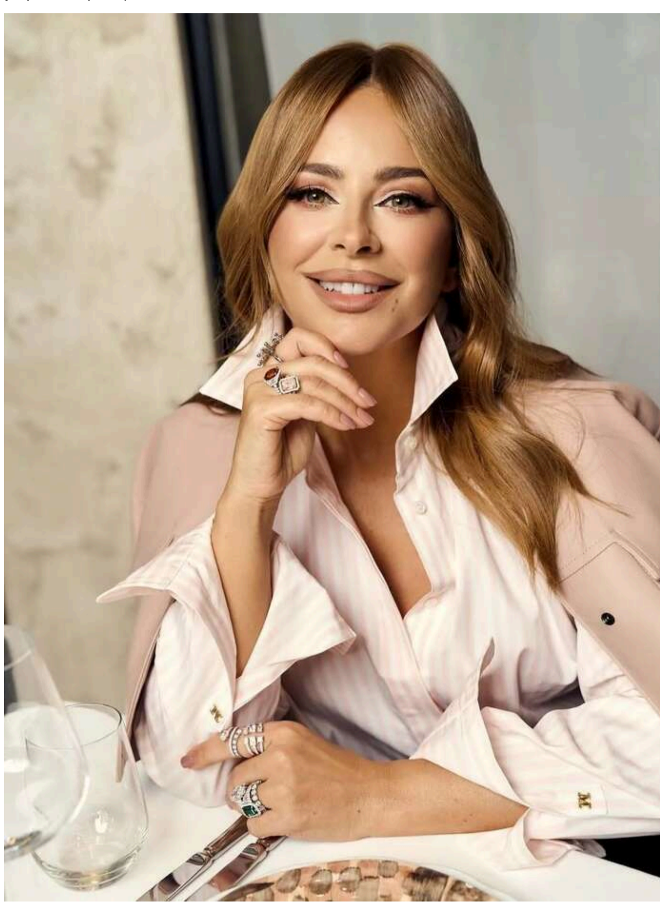
У власності Ані Лорак нерухомість площею 50 квадратних метрів у столичному

Про це стало відомо з даних реєстру прав на нерухоме майно. Що цікаво, останню квартиру в Києві виконавиця оформила на себе незадовго до початку повномасштабної війни, хоча вже активно розвивала кар'єру в Росії. Це вкотре демонструє, що гучні заяви зрадниці про те, що їй "перекривали шляхи" та не давали розвиватися в Україні – вигадка, яка допомагає зберегти "місце під сонцем" у країні-агресорі.