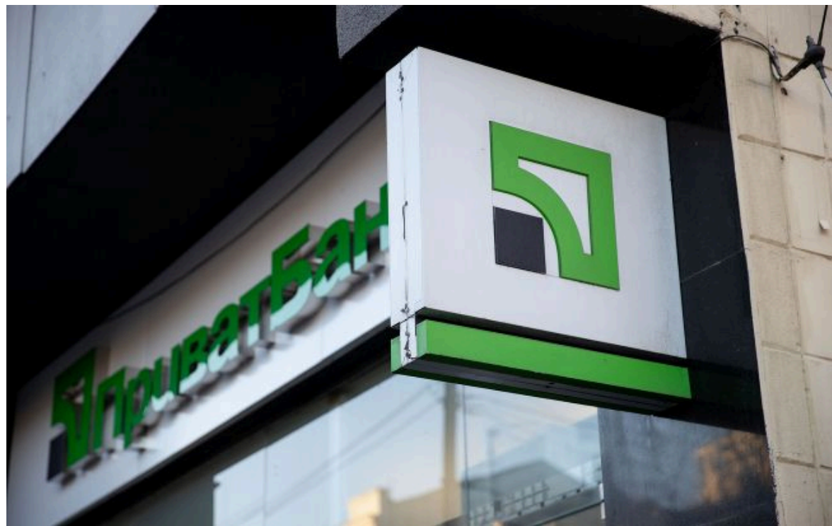
Фото: відділення ПриватБанку (Getty Images)