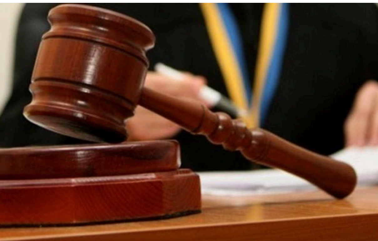
Люксові авто та готівку екс-посадовця визнали необґрунтованими

Встановлено, що його повсякденні видатки значно перевищували задекларовані доходи і унеможливлювали придбання ще й люксових авто.