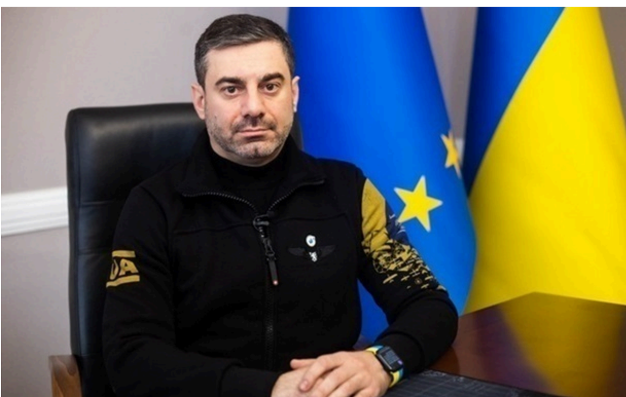
Уповноважений ВР України з прав людини Дмитро Лубинець

Після втручання Офісу омбудсмена було звільнено п'ятьох громадян, двоє з них із психічними розладами, ще один - із довічною інвалідністю II групи з дитинства.