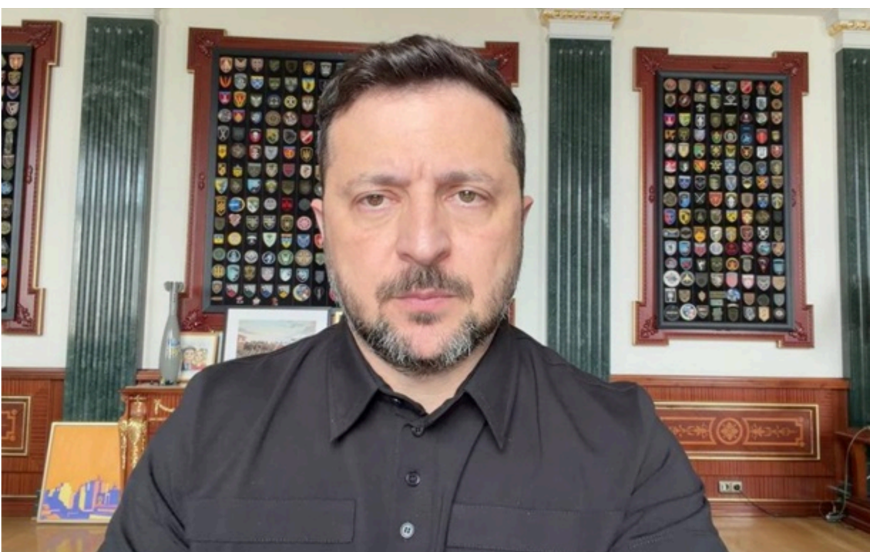
Володимир Зеленський звернувся до громадян України

Повітряні сили ЗСУ попередили про високу ймовірність застосування росіянами ракети Орешнік упродовж доби.