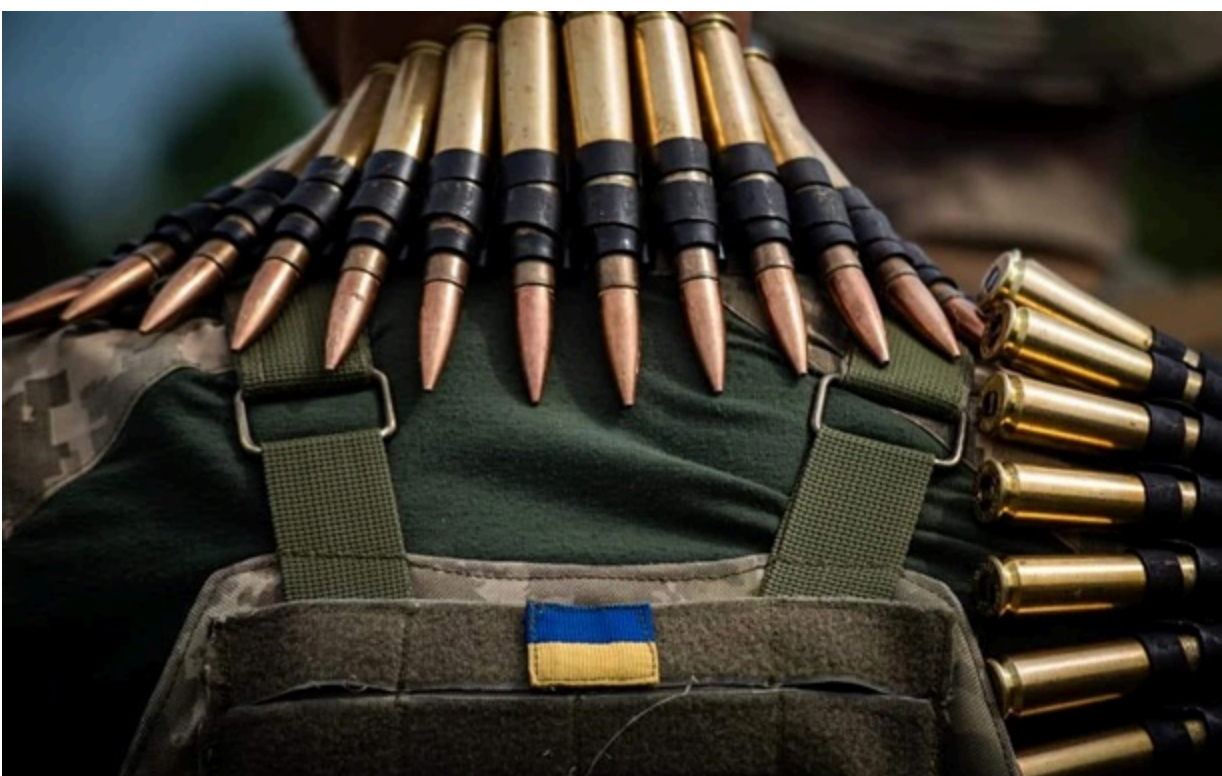
Українські військові матимуть нові контракти

Для військовослужбовців, які найдовше перебувають у Силах оборони, до кінця року планується поступове запровадження механізму звільнення зі служби.