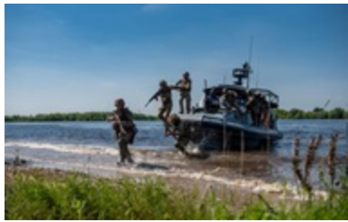
Кабін озовув строк запуску реформи в армії 10:55