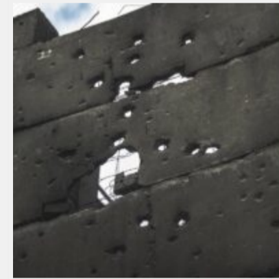
Як виглядає українська ТЕЦ, що пережила не одну ракетну атаку російських загарбників