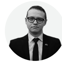
Автор колонки: Микола Белесков

У 2022 – 2024 роках Україна робила ставку на те, що політичний Захід використає виграний нами час для промислової і військової мобілізації по типу Першої і Другої світових війн, збільшуючи виробництво класичних категорій озброєння, військової техніки і БК.