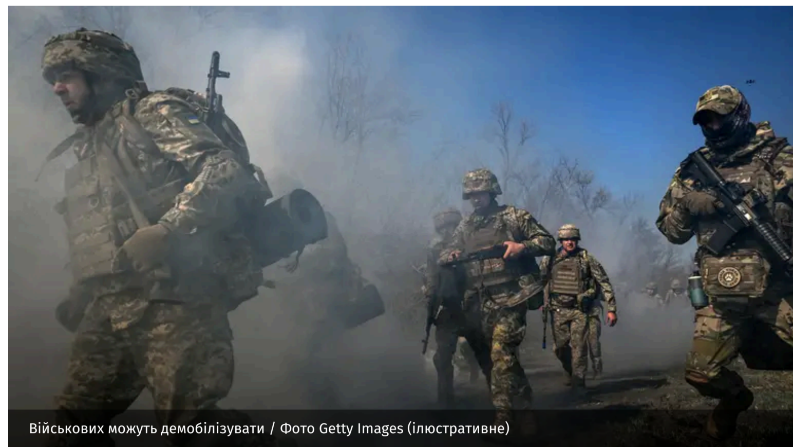
Військових можуть демобілізувати / Фото Getty Images (ілюстративне)

Володимир Зеленський анонсував поступове звільнення військових зі служби. Йдеться про бійців, які служать у Силах оборони найдовше.