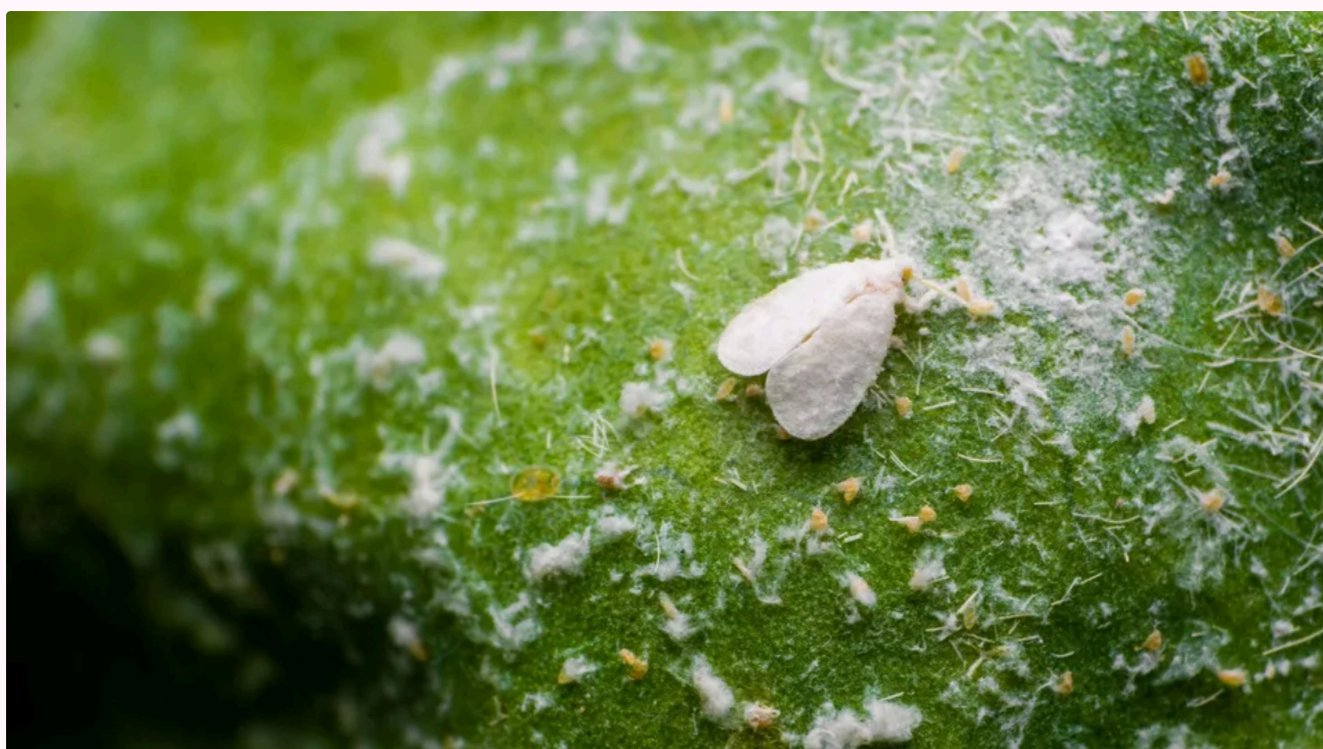
Білокрилка не загрожуватиме капусті

12 червня, 15.06 Этот материал также можно прочитать на русском