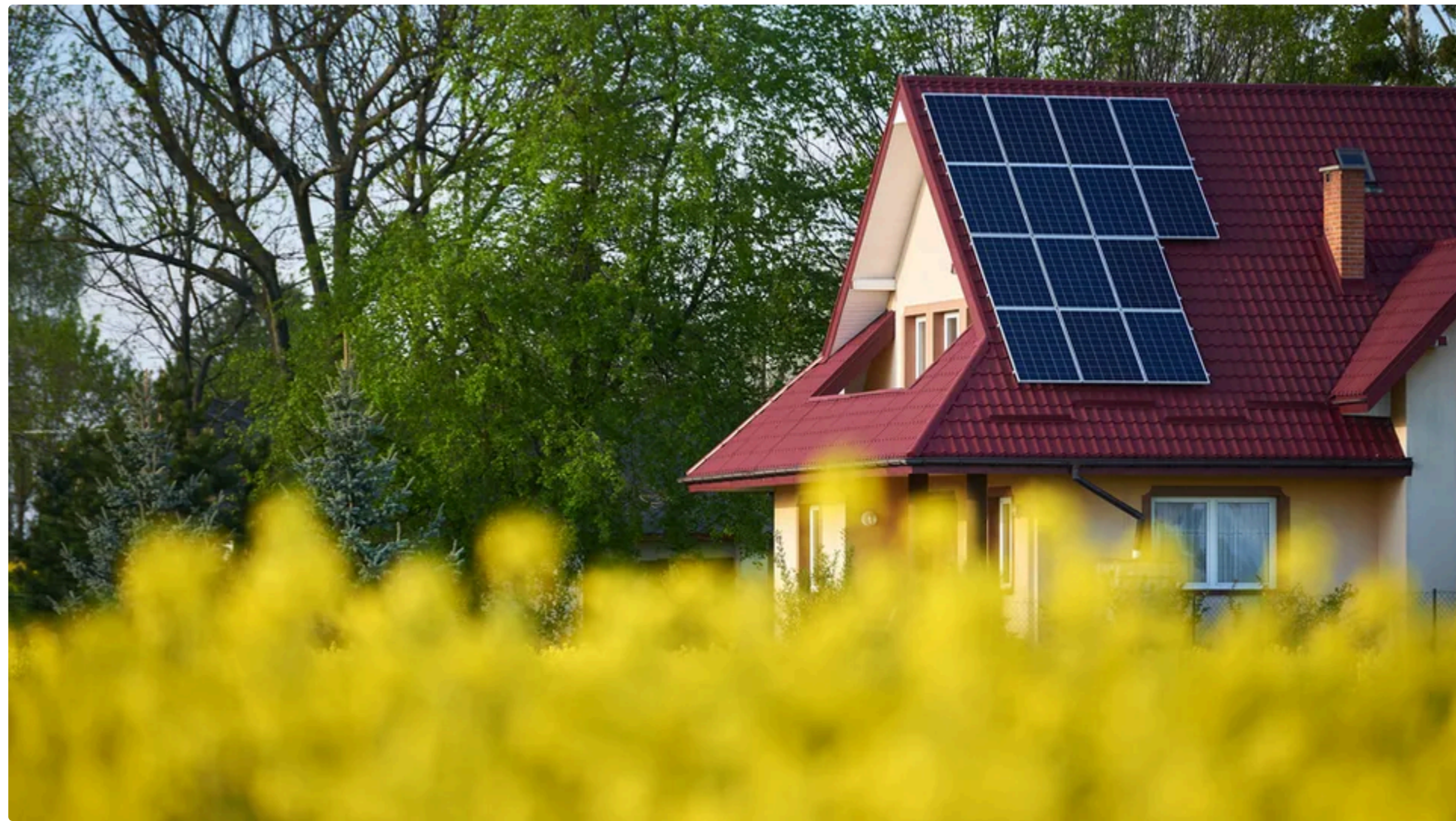
ДТЕК під'єднує до мереж домогосподарства із сонячними електростанціями

12 червня, 15:59 🗣️ Цей матеріал також можна прочитати на руском