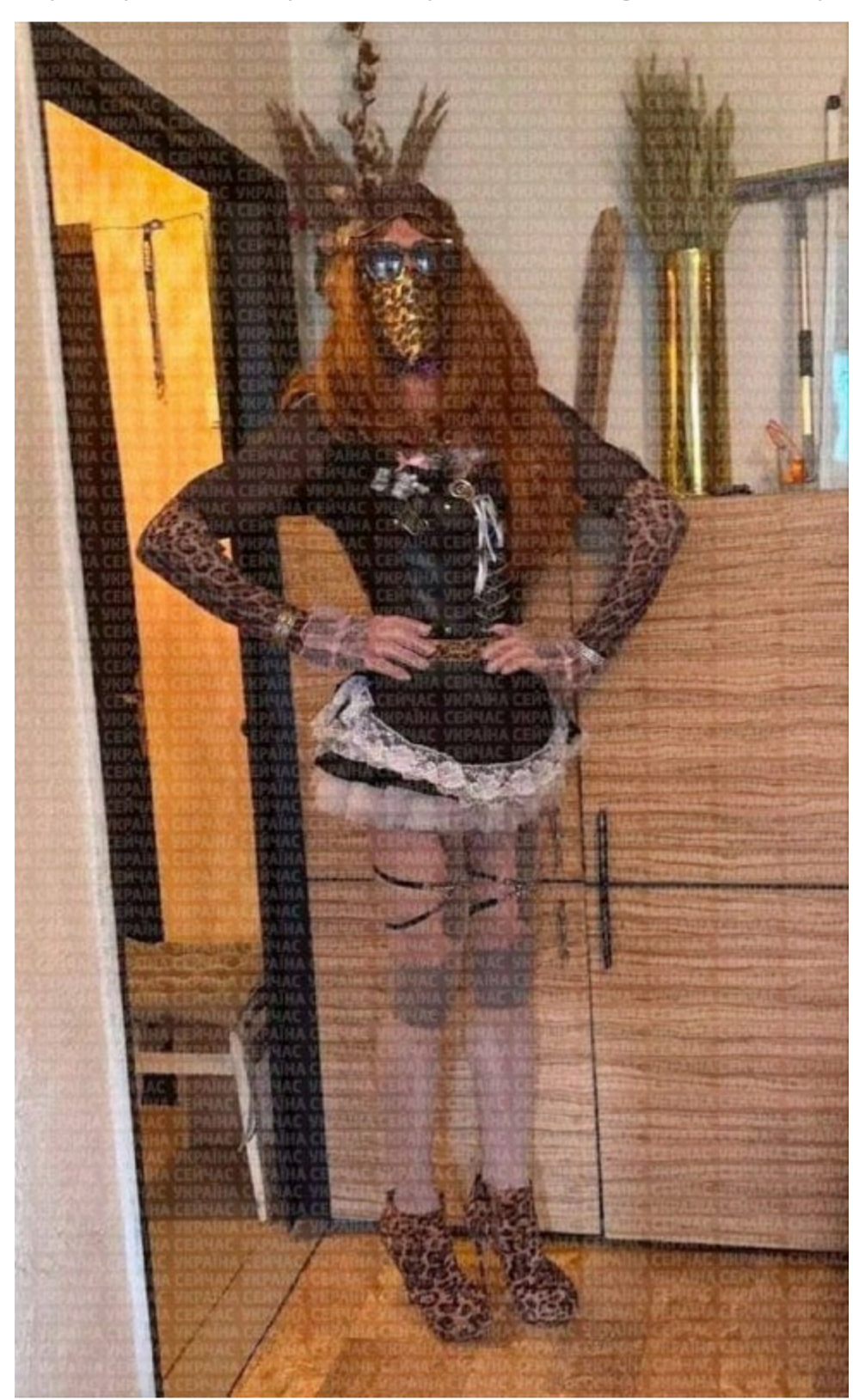
Наркогрогровець в образі «Ельвіри»

Під час санкціонованого обшуку в оселі затриманого правоохоронці виявили величезний склад різноманітних психотропних речовин. Загалом вилучено понад 2,5 кілограма нелегального товару, вартість якого за цінами «чорного ринку» сягає близько 5 мільйонів гривень.