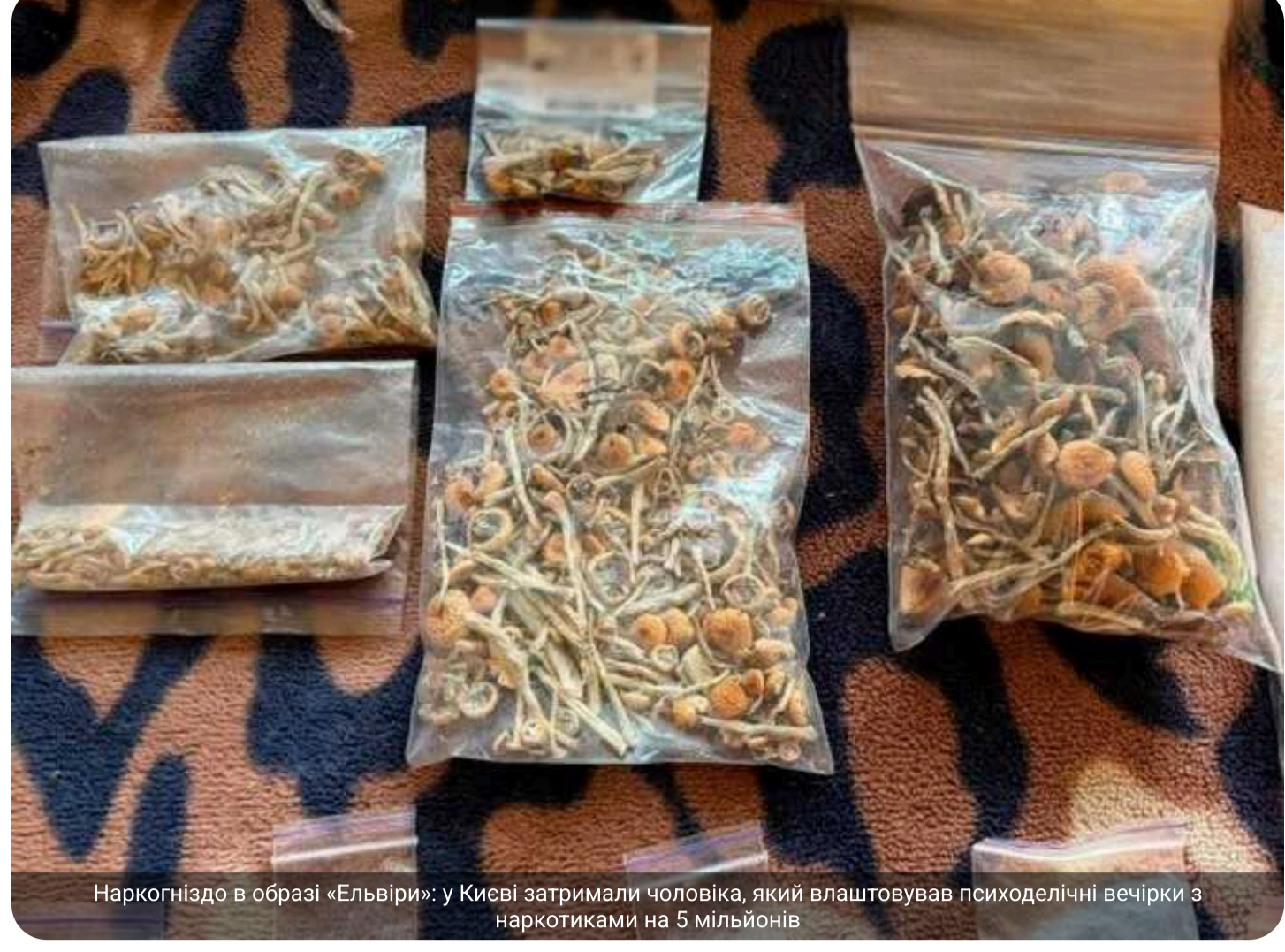
Наркогніздо в образі «Ельвіри». У Києві затримали чоловіка, який влаштовував психоделічні вечірки з наркотиками на 5 мільйонів

У Шевченківському районі Києва правоохоронці викрили та затримали 50-річного чоловіка, який налагодив канал постачання наркотиків. Зловмисник перетворив власну квартиру на наркогніздо, де влаштовував масштабні тематичні вечірки, перевтілюючись в епатажний образ «Ельвіри».