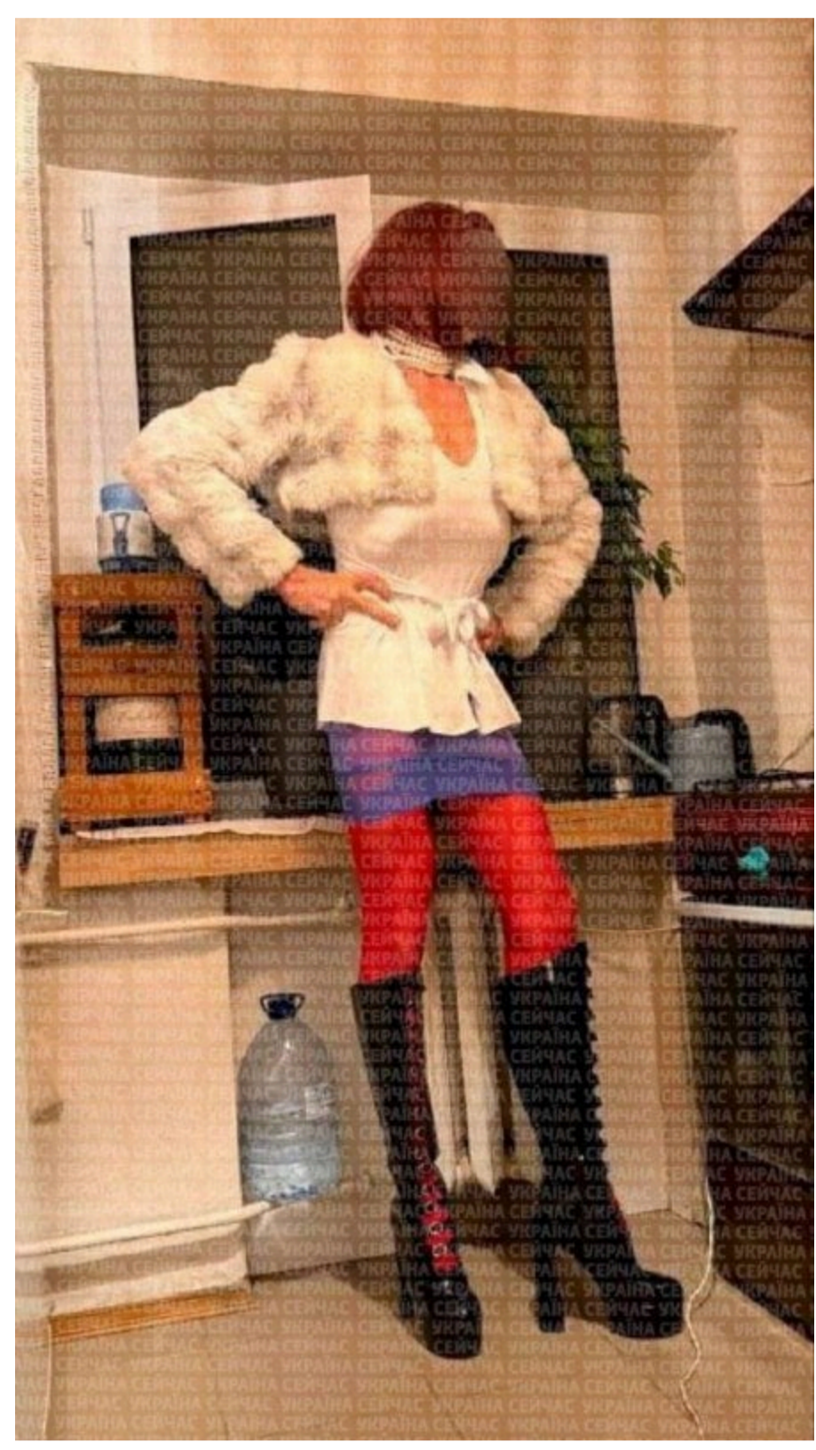
Наркогрогровець в образі «Ельвіри»