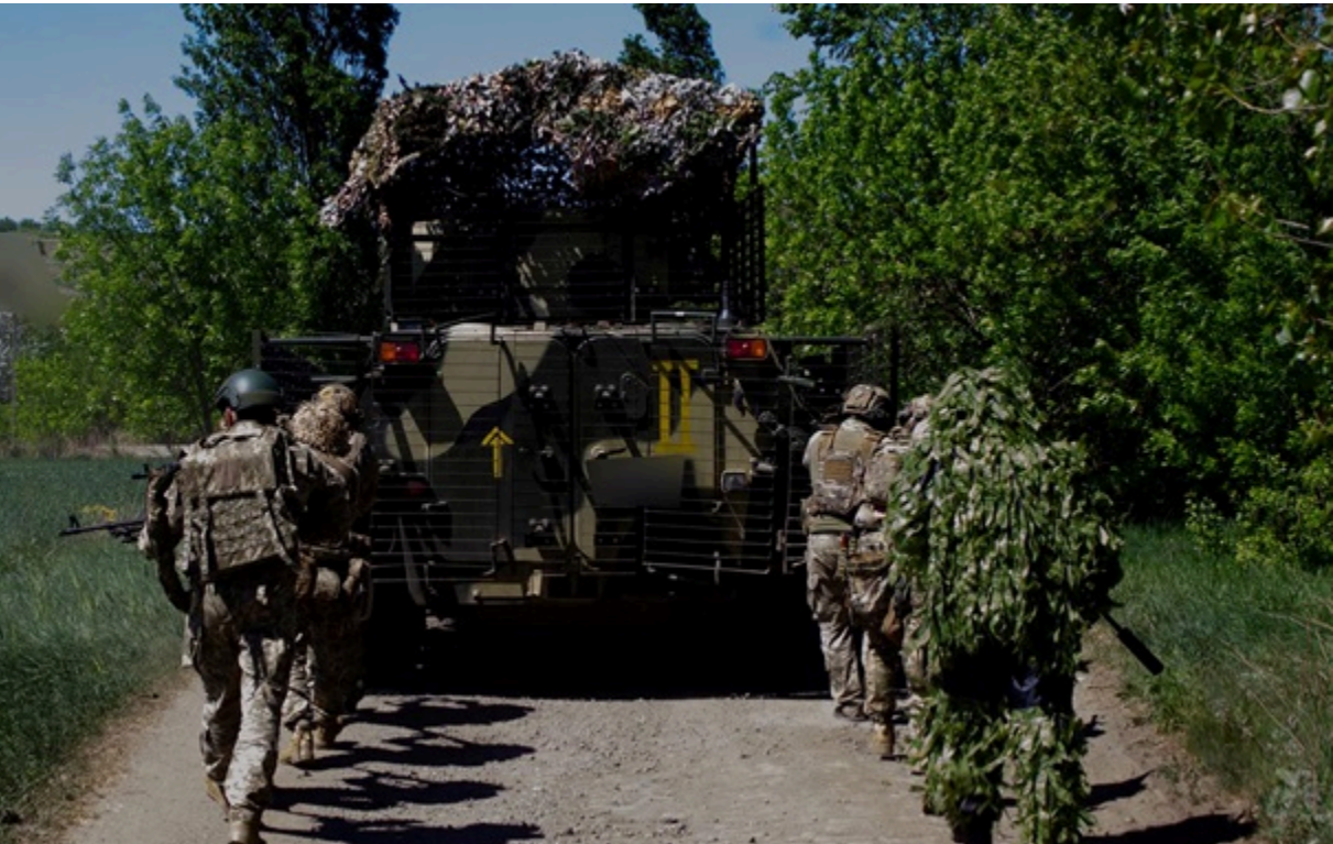
Українські військові отримуватимуть більше грошей

Глава держави розраховує, що кожен елемент змін, які зараз впроваджуються, за поточне літо покаже свою ефективність.