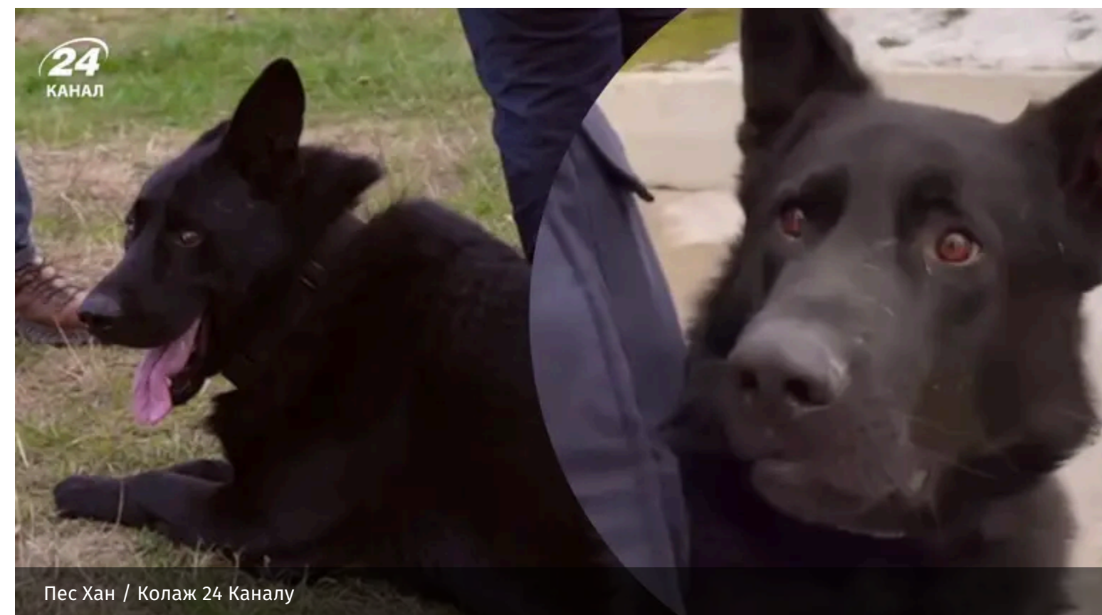
Пес Хан

Пішов із життя досвідчений пошуково-рятувальний пес Хан. Він ніс службу у Мобільному рятувальному центрі швидкого реагування "Суми".